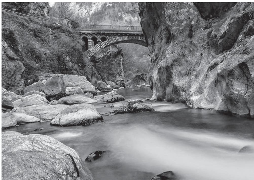
Ura e gurit në grykën e Rugovës.