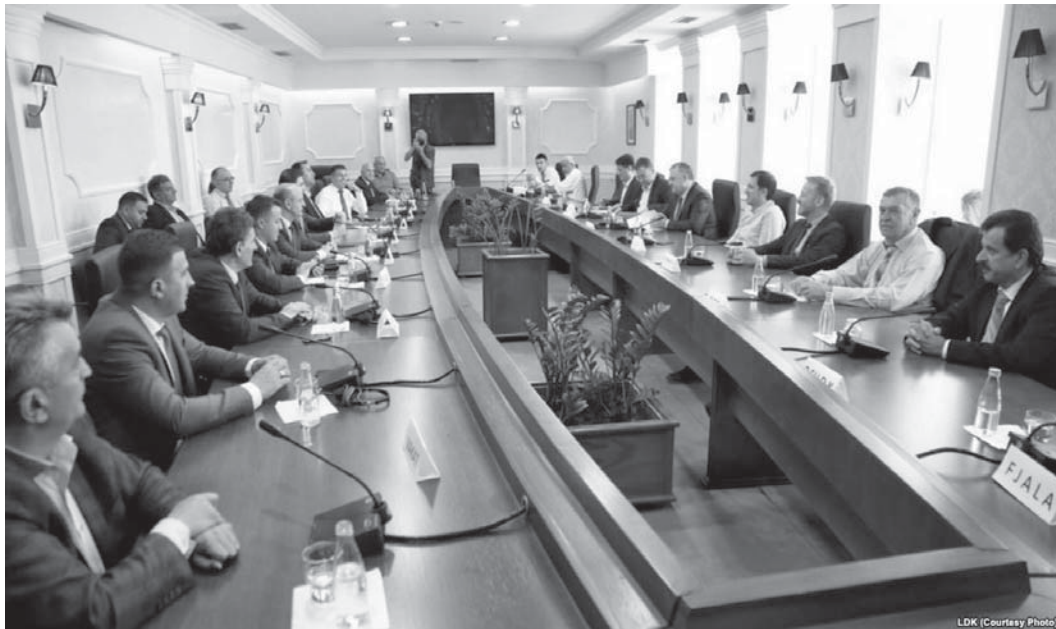
LDK

Ndërkaq shefi i grupit parlamentar i PDK-së, Memli Krasniqi, ka thënë se është rastësi që temat e diskutuar në këtë tryezë të kenë ngjashmëri me ftesën që ka bërë ditë më parë kryetari i PDK-së, Kadri Veseli, për një platformë gjithëpërfshirëse. "Pajtohemi se duhet të ketë një pjesëmarrje, një gjithëpërfshirje, një konsensus të partive politike, të spektrit më të gjerë politik, në mënyrë që t'i kalojmë ato në një mënyrë më të shpejtë dhe më të lehtë. Veçanërisht, ato që ndërlihdhen me temat siç janë: themelimi i ushtrisë, procesi i dialogut për normalizimin e marrëdhënieve ndërmjet