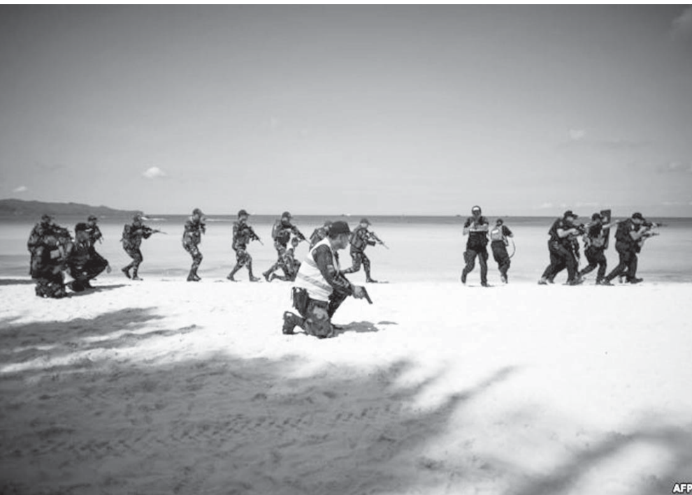
Policët marrin pjesë në një stërvitje të masave të sigurisë në ishullin Boracay në Filipine.