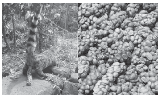
dhe më pas ato mblidhen për t'u konsumuar nga njerëzit.

Kafja e quajtur "Kopi lumak" është e njohur si një nga kafet më të shtrenjta në botë me rreth 700 dollarë për kilogram. Si është e bërë? Një kafshë e vogël aziatike ushqehet me kafën e papjekur në pemë dhe më pas i nxjerr në formë jashtëqitje