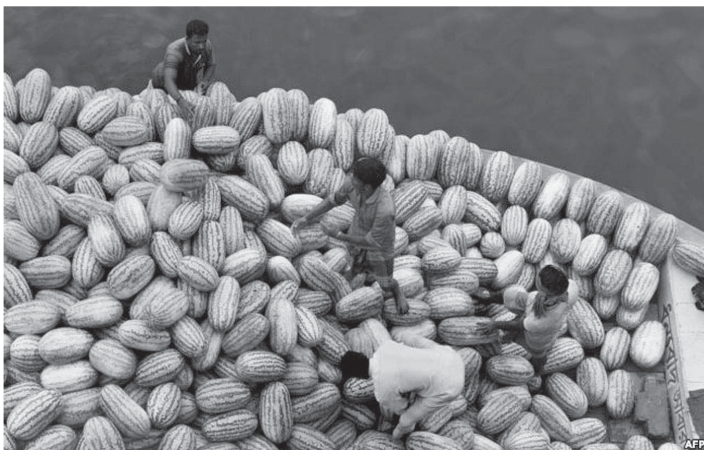
Punëtorët shkarkojnë shalqinj të nga një varkë në lumin Buriganga në Bangladesh.