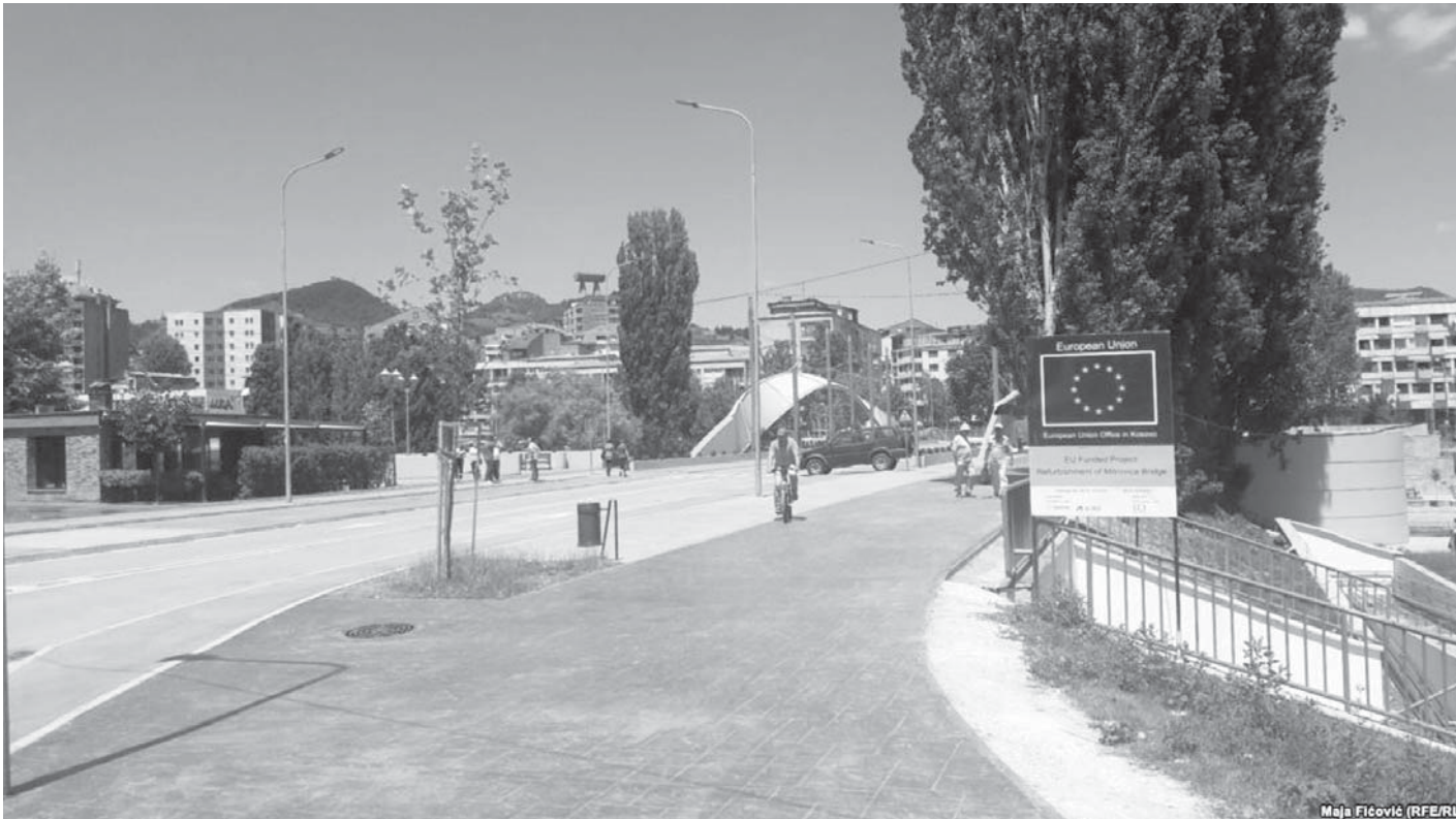
Maja Filçović (RFE/RL)

Tani konstruksioni i ri përbën një ndërtim betoni prej 53 metrash të gjatë, kurse lartësia do të jetë nga 40 deri në 70 centimetra.