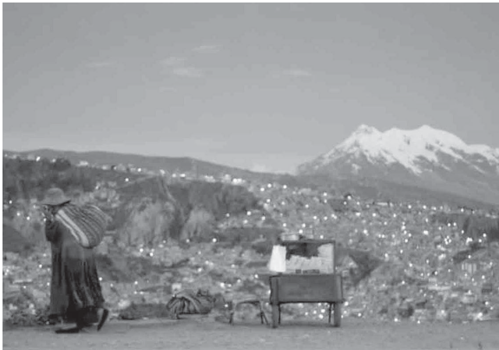
Një grua shihet duke ecur në La Paz të Bolivisë pranë një stalle të kokoshkave.