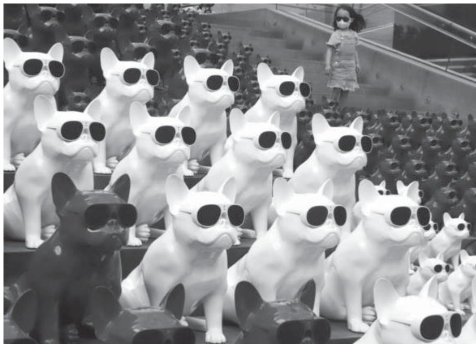
Një fëmijë me një maskë të vendosur në fytyrë ecën përkaj qenve të shfaqur në një distrikt pazaresh në Pekin.