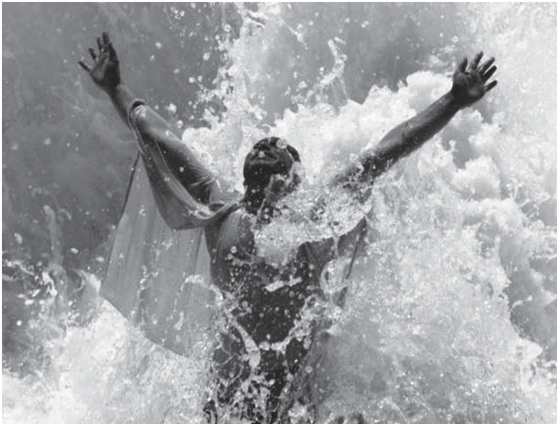
Temperaturat kanë arritur rreth 42 gardë celsius në periferi të Jalalabadit në Afganistan.