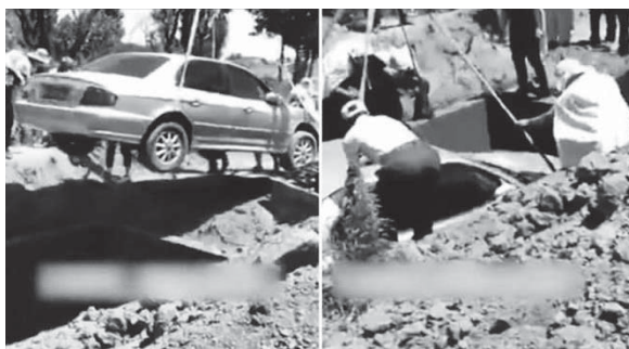
la amanet që trupi i tij të hidhej në makinë, në vend të arkivolit tradicional.

Një person i apasionuar pas makinave në Kinën Jugore ka kërkuar të varrosset brenda një makine pas vdekjes së tij. Ai vdiq të hënën në fshatin e tij në qytetin Baoding në provincën Hebe dhe e