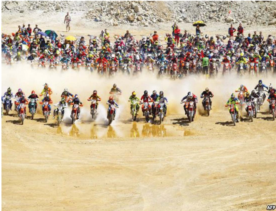
Në Austri u organizua gara me motoçikleta.