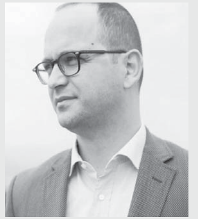
përmbushur kushtet për anëtarësim, tha Bushati.

dhe për t'u takuar me ministrin e Jashtëm Taro Kono dhe zyrtarë të Federatës Japoneze të Biznesit Keidanren. Lidhur me zgjerimin e BE-së, Bushati përshëndeti raportin e Komisionit në shkurt i cili sugjeron që vendet e Ballkanit Perëndimor, përfshirë Shqipërinë, mund të bëhen anëtare të BE-së deri në vitin 2025. "Ne e shohim atë si një faktor motivues, për t'i përshpejtuar reformat dhe për t'i