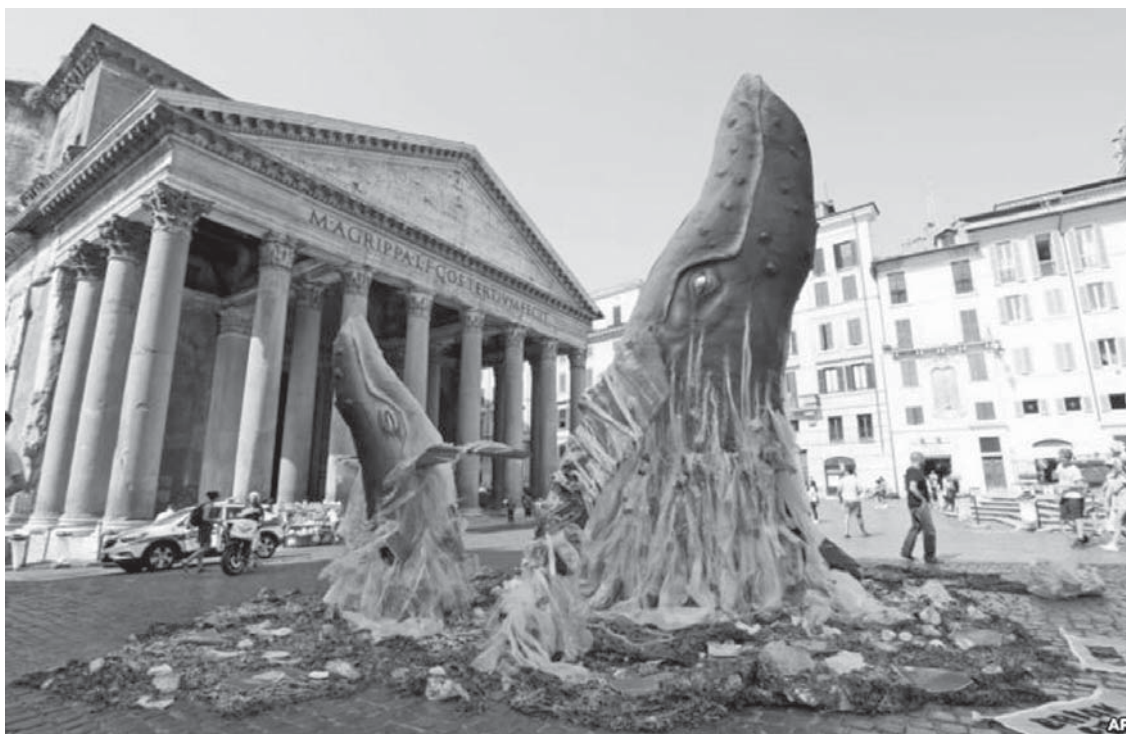
Dy balena të krijuara nga mbeturinat plastike në Romë të Italisë.