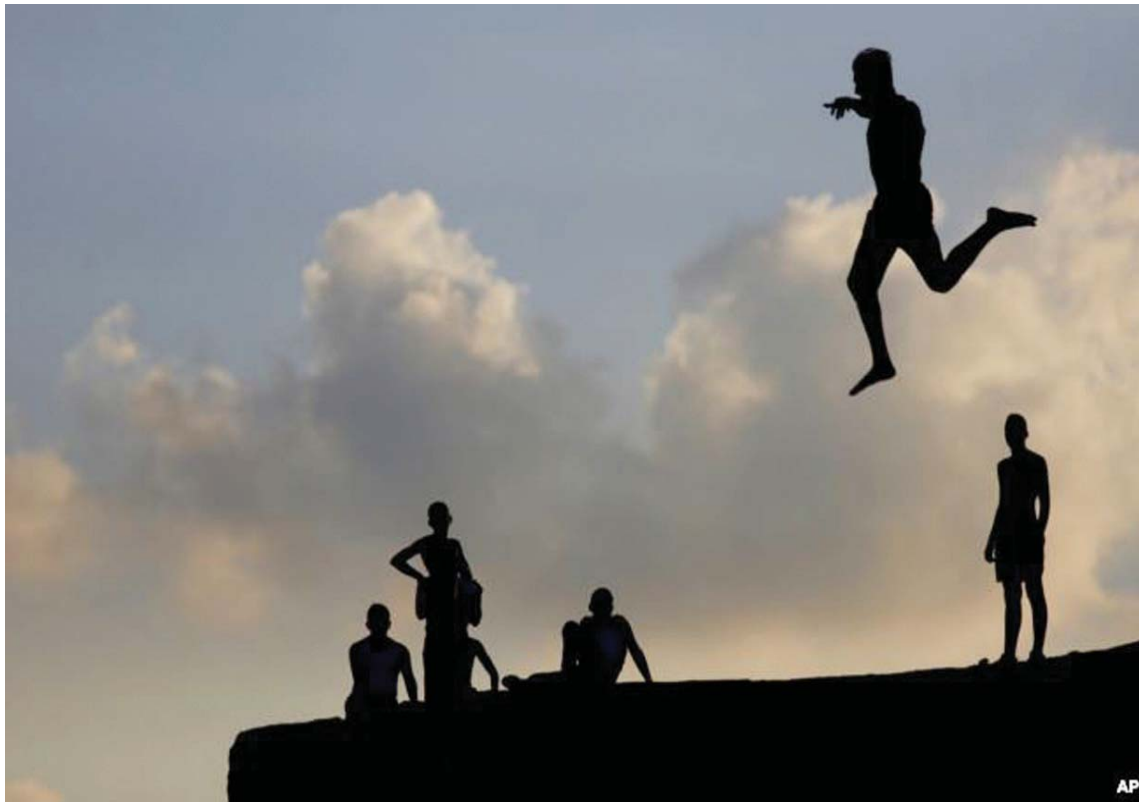
Djemtë arabë dhe izraelitë hidhen në detin Mesdhe nga muri i lashtë që rrethon qytetin e vjetër të portit të Akrit në Izrael.