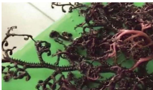
Mes hipotezave, është edhe ajo e një specieje të panjohur.

Kafshë apo çfarë? Studiuesit janë duke hetuar imazhet e një zbulimi të çuditshëm të ndodhur në një plazh në Vietnam, në provincën Kien Giang. Një guitë turistike është përballur me një krijesë misterioze, e ngjashme me një algë, por me tentakula që të kujtojnë ato të një oktapodi.