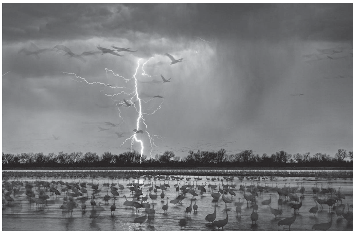
Ndriçimi nga rrufeja mbi Lumin e Drurit, Nebraska.