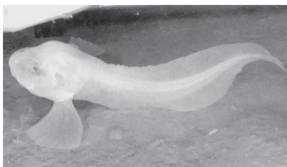
peshkut është si gjel likuid dhe i gjen me ngjyrë të kuqe dhe blu. Këto krijesa janë kanë gjatësi 20 deri në 25 cm.

Shkencëtarët kanë zbuluar tri lloje të reja të peshqve "hardcore" që jetojnë në një nga pjesët më të thella të oqeanit dhe që janë krijesa pa shtyllë kurrizore, të përshtatura në mënyrë të përkryer me kushtet që do ta vrisnin menjëherë jetën në tokë. Trupi i këtij lloji të