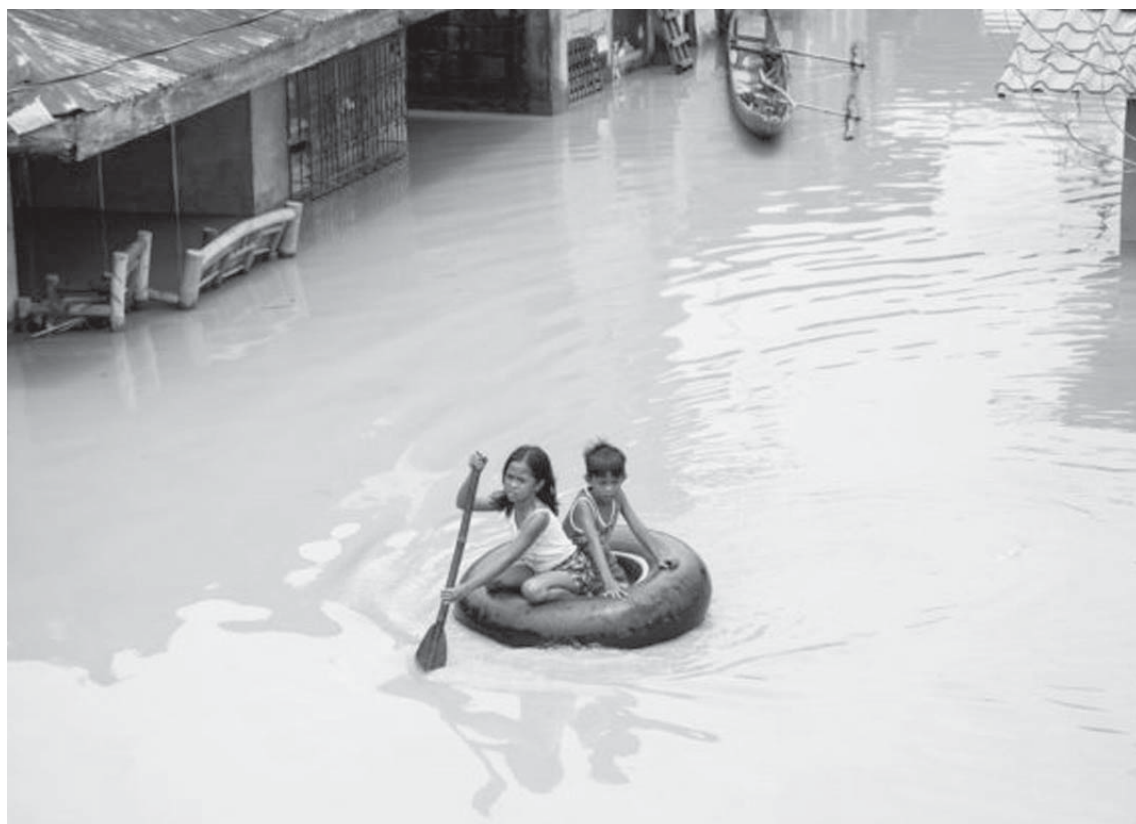
Fëmijët përdorin një gomë për të kaluar një rrugë të përmytur në Filipine.