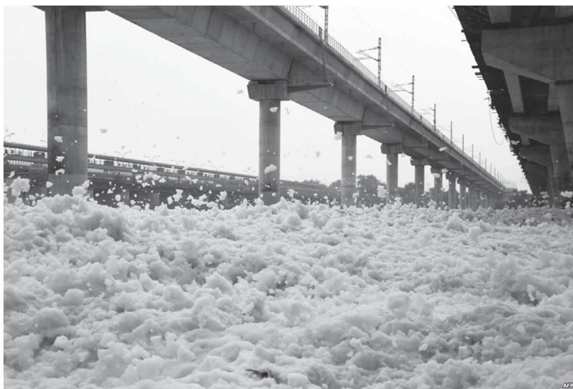
Shkuma e mbledhur në lumin e ndotur Yamuna në Nju Delhi të Indisë.