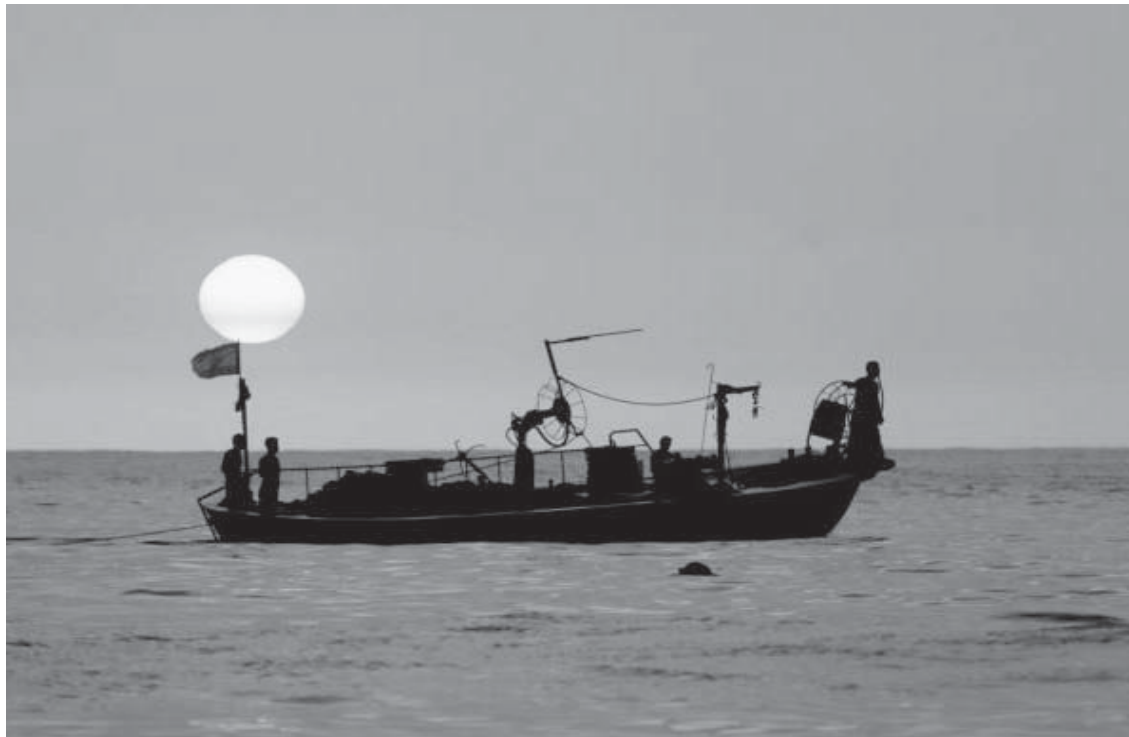
Peshkatarët një anije peshkimi në Detin Mesdhe në perëndim të diellit në Liban.