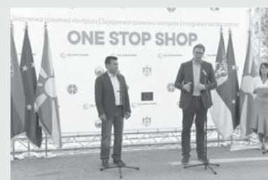
u takuan të dielën për të diskutuar për kalimin e unifikuar të kufirit midis Serbisë dhe Maqedonisë.

sishme për Serbinë dhe perspektivën e saj evropiane dhe të rajonit në përgjithësi", ka thënë tutje Zaev. Kurse presidenti serb, Aleksandër Vuçiçi, ka thënë se i është mirënjohës kryeministrit Zaev për qëndrimin e tij ndaj dialogut me Prishtinën. Zoran Zaev dhe Aleksandër Vuçiçi