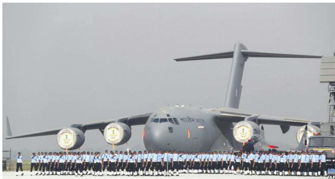
Ushtarët e forcave ajrore indiane marshojnë gjatë paradës së Ditës së Forcave Ajrore të Indisë.