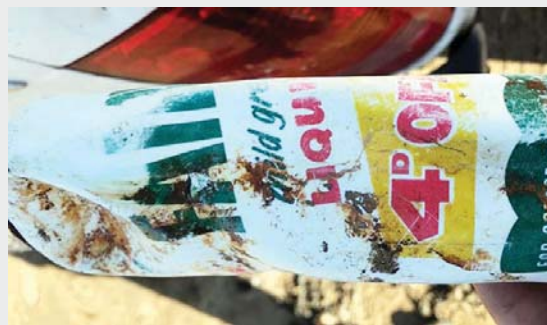
roje bregdetare në një plazh në Somerset, duket si e re.

Një shishe plastike që ka të paktën 47 vjet në det është gjetur në bregun e një plazhi në Britaninë e Madhe, me shkrimet në ambalazh që lexohen qartë, duke rikthyer edhe një herë përpara syve tanë problemin e mbe-turinave plastike. Shishja, e gjetur nga një