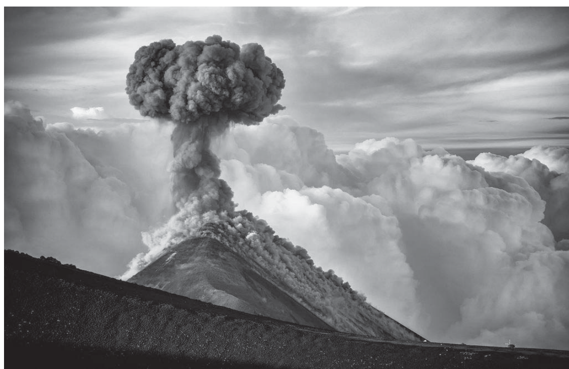
Vullkani de Fuego i Guatemalës ose vullkani i zjarrit është një nga vullkanet më aktive në botë.