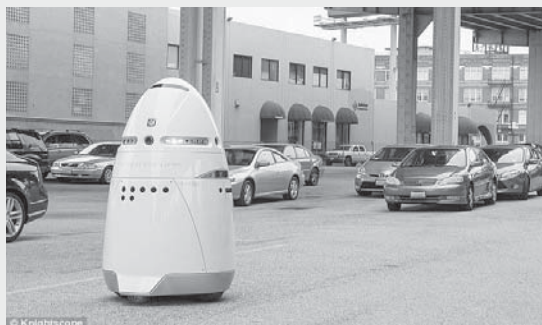
parkingje, rrugë, por edhe qendra tregtare, shtëpi dhe vila të mëdha.

Duhej pritur që, për tema të tilla, siguria do të kalonte edhe përmes robotëve. Ata që tashmë janë në përdorim në 16 shtete amerikane, janë programuar të kuptojnë atë që bëjmë, ku shkojmë dhe cilat synime kemi. Ata patrollojnë pa u ndalur, madje edhe nën mot të keq, aeroporte,