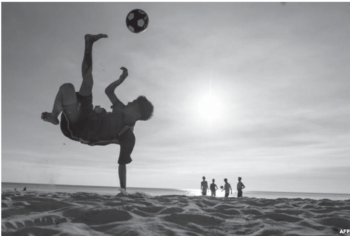
Një djalë duke luajtur futboll në një plazh në ishullin Filipinas në Boracay.