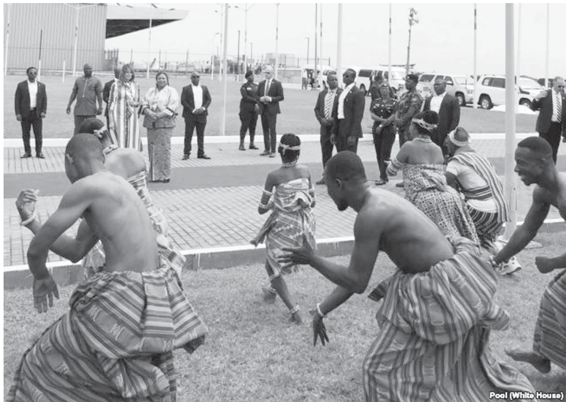
Zonja e Parë Melania Trump shihet në një ceremoni mirëseardhëse për në Gana.