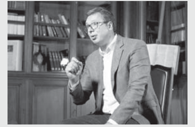
pandashme, e pavarur dhe shumetnike".

Kosovës dhe në muajt e verës edhe të disa komunave të Kosovës, përfshirë edhe kryeqytetin. Në një deklaratë pas vizitës presidenti Thaçi tha se "ishte një vizitë e zakonshme fundjave", ndërsa ritheksoi se "Kosova është një, e