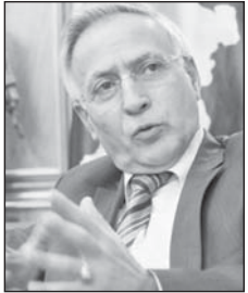
Shkruan: Jakup KRASNIQI