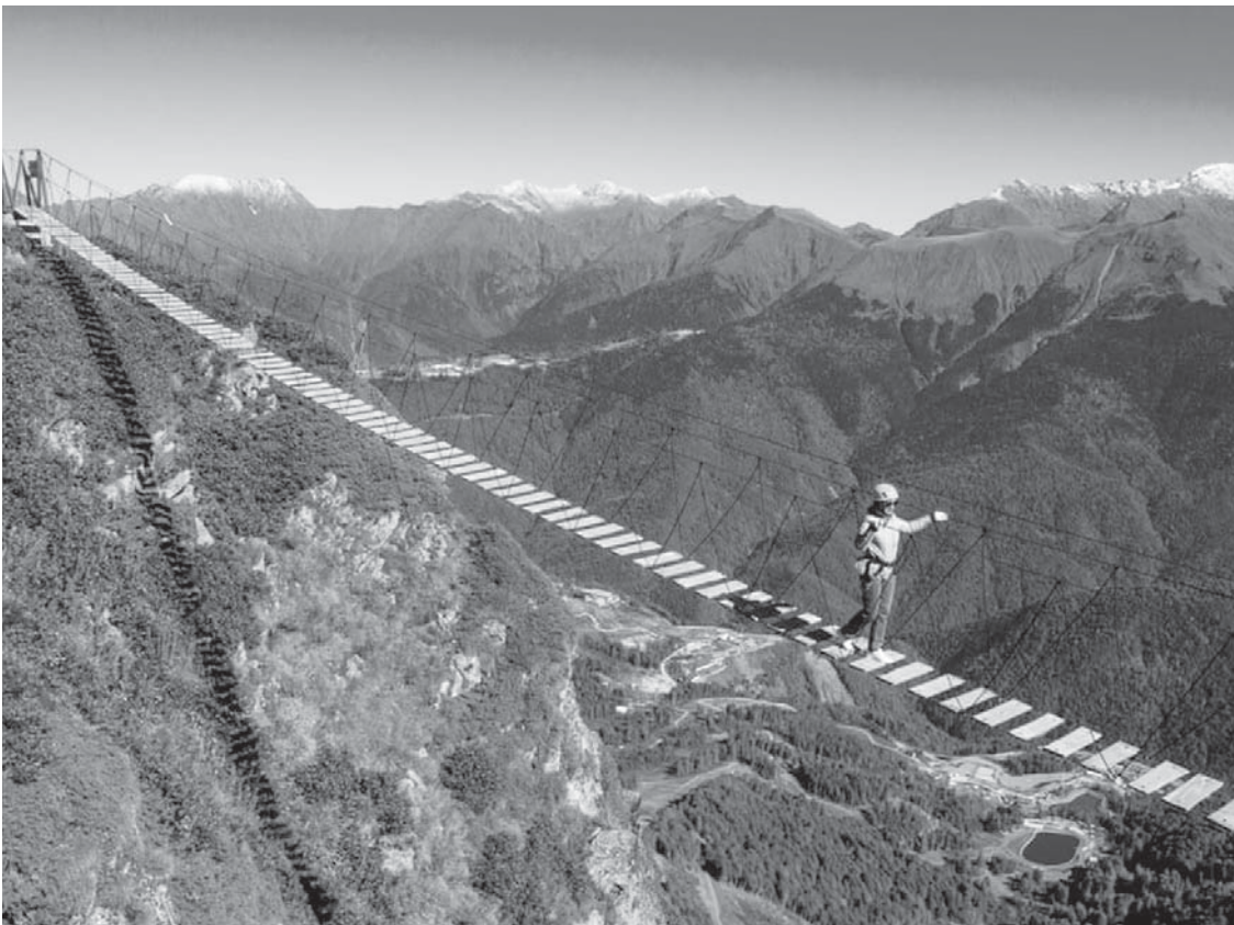
Një grua ecën përgjatë një ure në një lartësi prej 2 320 metrash në vendpushimin e skive Rosa Khutor në Rusi.