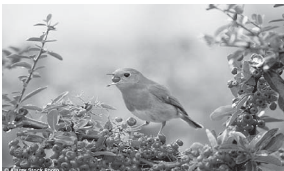
"Zogjtë hanë fruta të fermentuar më shpejt këtë vit për shkak të një acari në zonë".

Policia në një komunitet të vogël të Minesotës veriore ka marrë disa telefonata të çuditshme për zogjtë që duken si të dehur. Qytetarët në Gilbert kanë raportuar se zogjtë fluturojnë të hutuar në dritare dhe në makina. Në një mesazh në "Facebook", departamenti i policisë thotë se ka një shpjegim të thjeshtë për rastin: