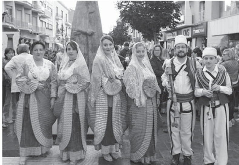
Banorët e Spezzano Albanese (Cosenza) me veshjet tipike të komunitetit arbëresh

takua me homologun e tij shqiptar, Ilir Meta dhe së bashku përruan një pllakë përkujtimore kushtuar Skënderbeut, shumë të dashur nga trashëgimtarët e komunitetit albanofon kalabrez, trashëgimtarë të popullatave të mbërritura shumë vite më parë në Itali.