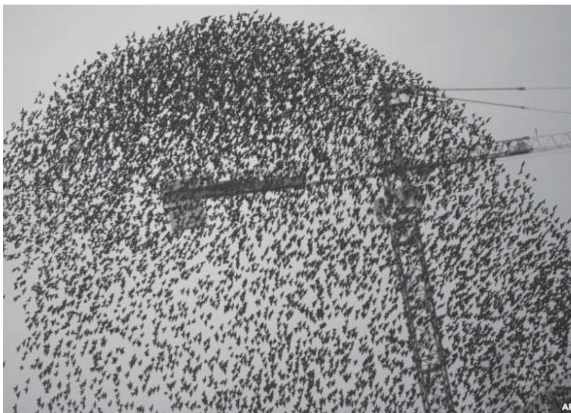
Një kope zogjsh shihen afër një vinçi në Milano të Italisë.