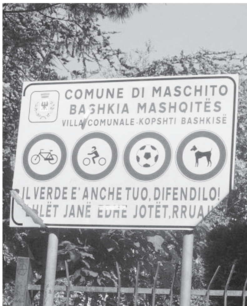
Tabelë udhëzimi në gjuhën italo-shqiptare, në komunë Maschitto, në provincën e Potenza-s

mbizotërimin otoman dhe Vendi i Shqiponjave, pak nga pak u dorëzua para pushtimit turk. Që këtu do të nisë emigracioni intensiv drejt tokave puljeze, në veçanti në zonat e Otrantos dhe të Capitanata-s. Që atëherë shqiptarët vazhduan të krijonin zona të reja komunitare në mesdhe deri në gjysmën e parë të shekullit të 18-të. Falë mbështetjes së rëndësishme të klerit për të ruajtur një identifikim specifik etnik, në '900 u institucionalizuan dy peshkopata për shqiptarët, një në Sicili dhe një e dytë