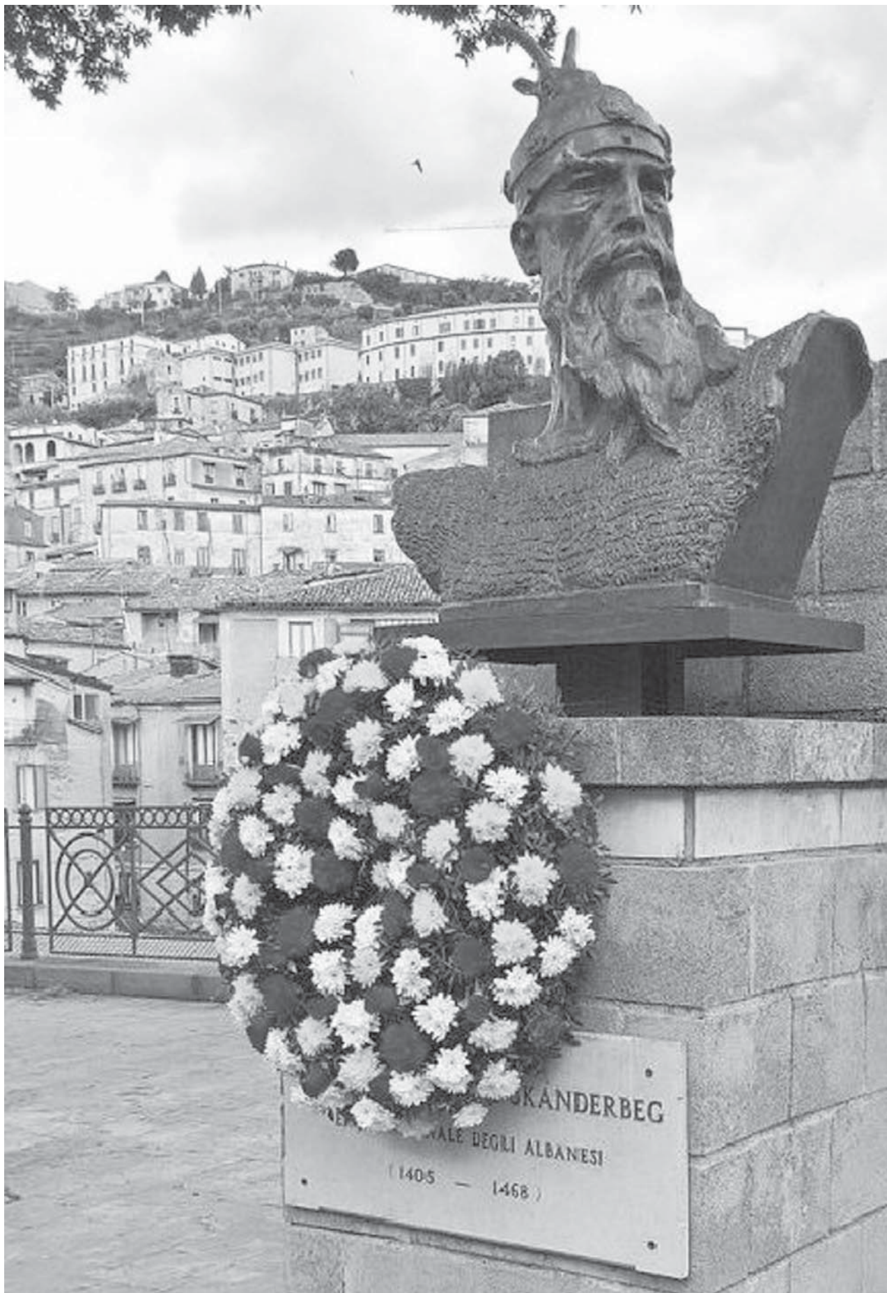
Busti i Gjergj Kastrioti Skënderbeut në qendër të Cosenza-s

Diaspora shqiptare ka mbërritur mes shekullit XV dhe XVIII, në vijimësi pas vdekjes së heroit kombëtar (Giorgio Castriota Skanderbeg), Gjergj Kastrioti Skënderbeu, (1405-1468). Pavarësisht nga sukseset e tij në fushën ushtarake, udhëheqësi shqiptar nuk arriti të pengojë