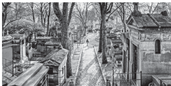
famshëm të letërsisë. Pra, përveçse një vend varrimi, kthehen edhe pika historike, oaze në mjedisin urban.

Në botën moderne është e vështirë që vdekja dhe e bukura të vendosen në të njëjtën fjalë, por arti i mendjes krijuese të njeriut e ka futur të bukurën edhe në stacionin e fundit të jetës. Varrezat Père Lachaise në Paris sot kanë me dhjetëra mijëra varre, edhe të disa personave të