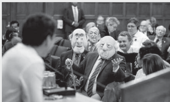
vetëm nga pamja e jashtme, por edhe nga pyetjet që bënin.

Deputetët kanadezë kanë festuar "Halloween"-in në një seancë parlamenti. Disa nga deputetët kanë vendosur të marrin pjesë me maska. Kryeministri Justin Trudeau ka shpërndarë në rrjetet sociale një fotografi ku thotë se disa nga deputetët nuk njiheshin jo