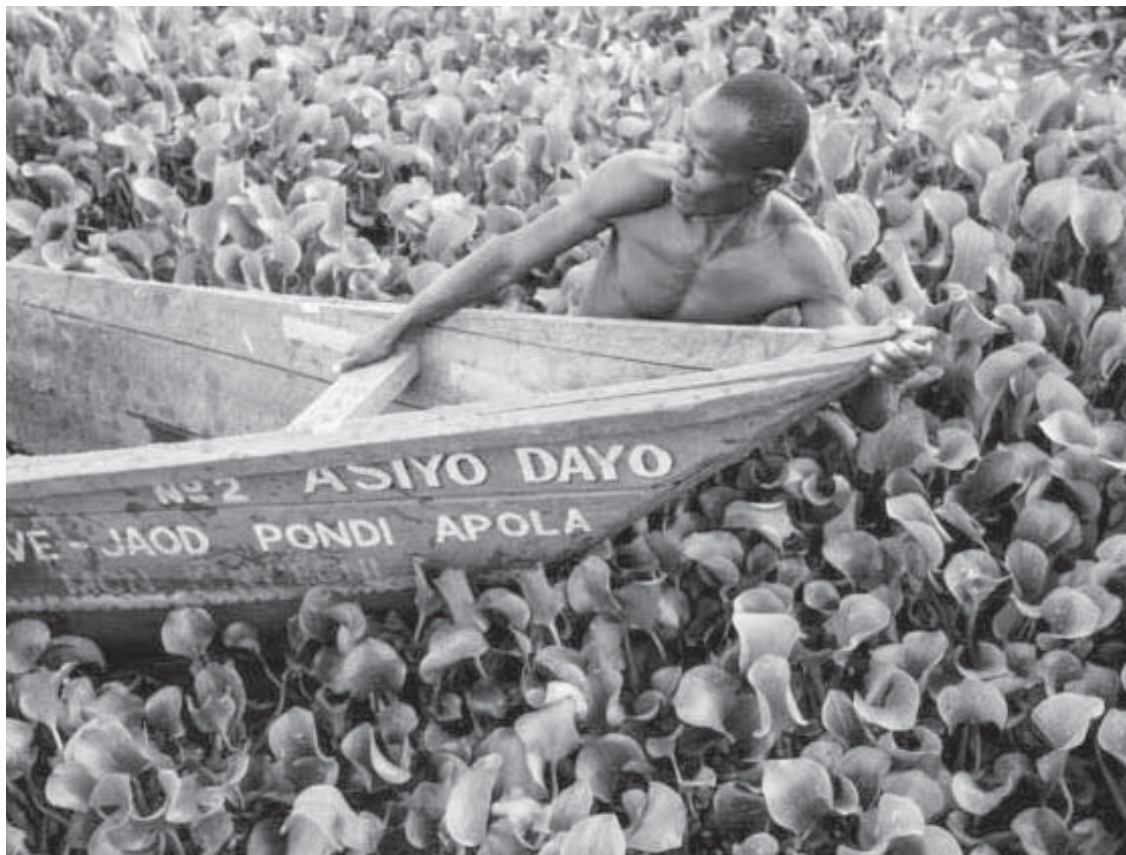
Një burrë tërheq një varkë në liqenin Victoria në plazhin e Kichinjio në Kisumu të Kenias perëndimore.