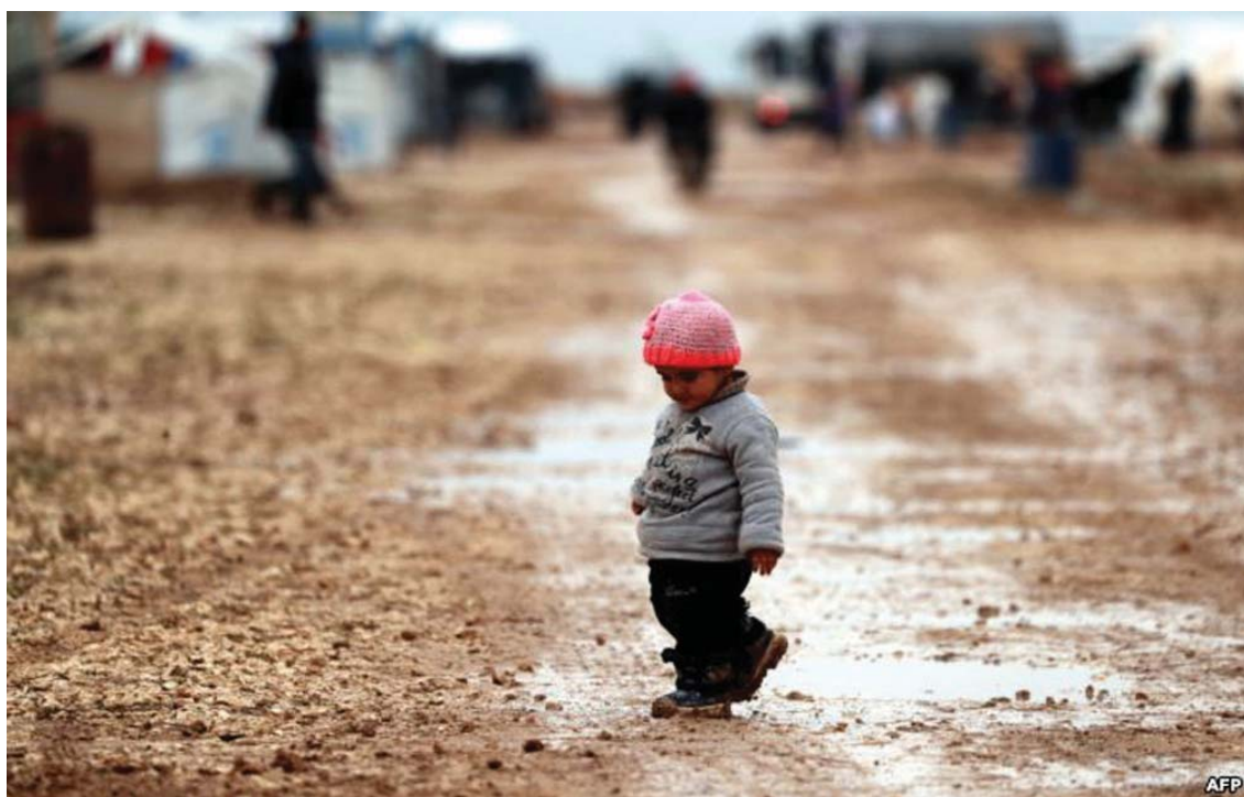
Një fëmijë shihet duke ecur në baltë në kampin afër qytetit të al-Arishah në krahinën veriore të Sirisë.