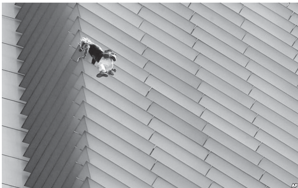
Alpinisti francez Alaine Robert, i njohur si 'Spiderman', ngjitet në ndërtesën 47-katëshe GT Tower, në qytetin Makati në lindje të Manilës në Filipine.