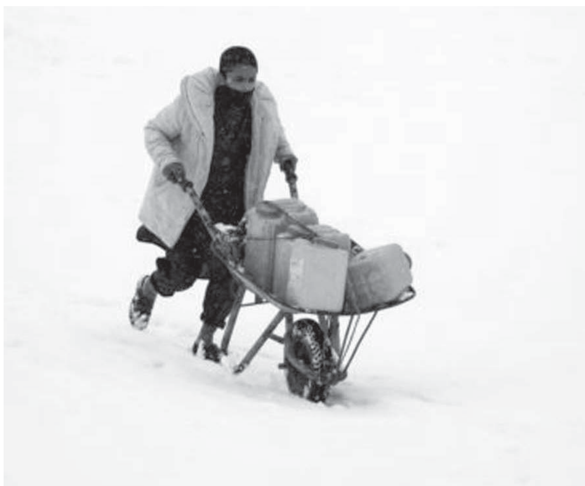
Një burrë në Kabul shtyn një karrocë me disa bidon në borë.