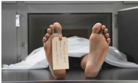
kufomës dhe këmba lëvizi e gruaja hapi sytë. "U ngjall", tregon mjeku në gjendje shoku, që menjëherë njoftoi kolegët e tjerë.

Një ngjarje që t'i futë dridhmat ka ndodhur në një qytet në Rusi. Një grua 62-vjeçare u shpall e vdekur dhe u transferua në morg. Policia ka vërtetuar vdekjen pa kërkuar ndihmën e mjekëve. Megjithatë sapo u transferua në morg, një punonjës i spitalit iu afrua për t'i vënë një tag në këmbën e