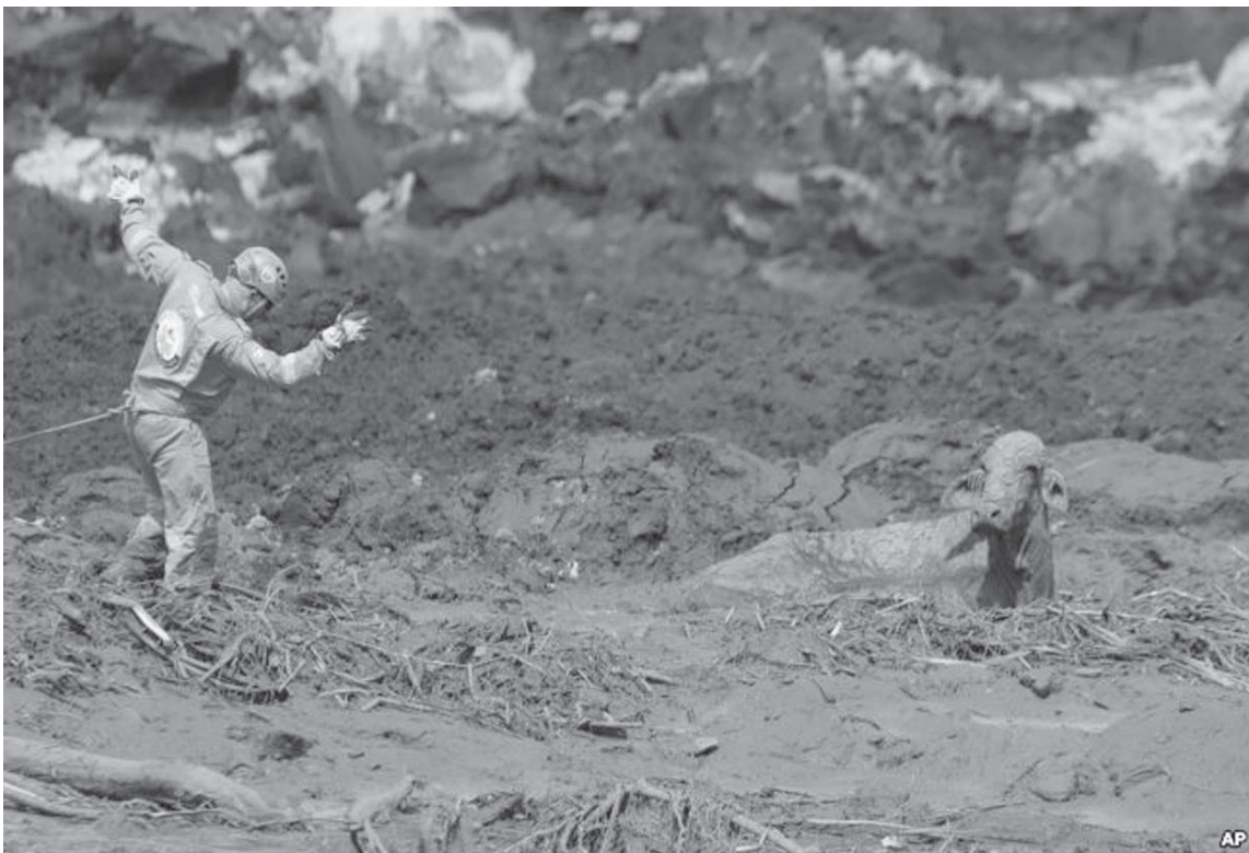
Një punëtor në Brazil shihet duke bërë përpjekje për ta shpëtuar lopën e cila ka mbetur në baltë.