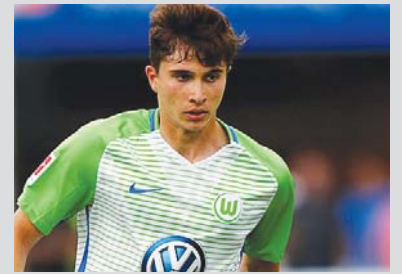
Gjermaninë. Megjithatë, së pari duhet të kemi vazhdimësi, të tjerat do të vijnë vetë", ka thënë Rexhbecaj.

Gjatë çdo dite pavarësisht çfarë moti ishte. Të paktën 20 minuta për xhiro gjendesha në biçikletë. Tani nuk kam më probleme gjatë kohës kur vrapoj. Paratë po ndikojnë në futboll e kjo më shqetëson edhe mua. Dikur ishim futbolistë normalë, sot bëhet fjalë për miliona dollarë. Do të ishte ëndërr që të luaja për