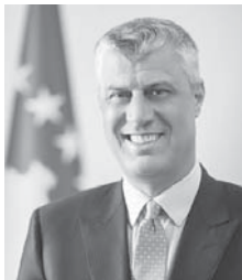
Shkruan: Hashim THAÇI

Kthesat e mëdha historike, të cilat e kanë vendosur fatin e shteteve dhe popujve anekënd botës, shpesh kanë qenë rezultat qoftë edhe i një vendimi të vetëm. Kështu ka ndodhur edhe me ne. Historia e popullit tonë është e përcaktuar nga momente të ndritshme, kur ne kemi marrë vendime të drejta, por edhe të mençura në momente të duhura, të cilat janë përkrahur nga shtetet e fuqishme. Nuk do të ishim të sinqertë me vetveten nëse mendojmë se nuk ka pasur raste kur kemi humbur mundësi historike për shkak të mungesës së vendimmarrjes ose vendimeve të gabuara.