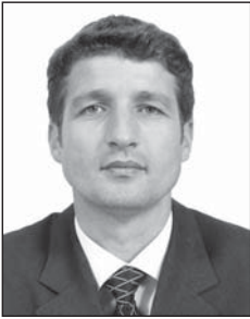
Shkruan: Agron HOTI