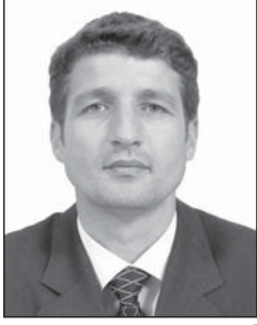
Shkruan: Agron HOTI