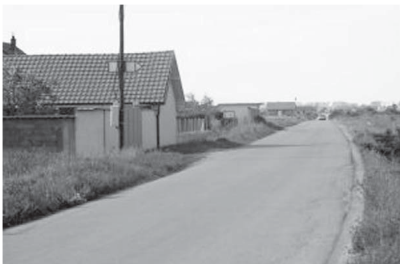
Pamje e fshatit Rubovc