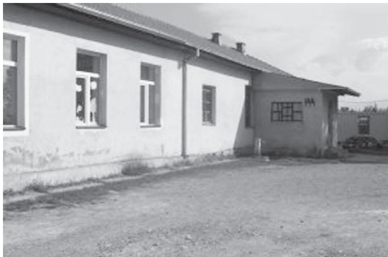
Shkolla e vjetër fillore e dy fshatrave të Rubovcit të Komunës së Lipjanit