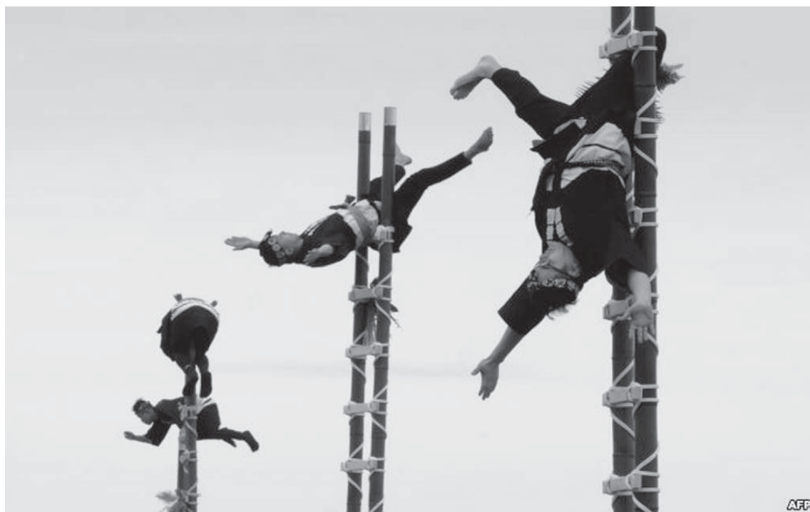
Anëtarët e Shoqatës së Ruajtjes së Zjarrfikësve Edo në Tokio performojnë me rastin e Vitit të Ri 2019.