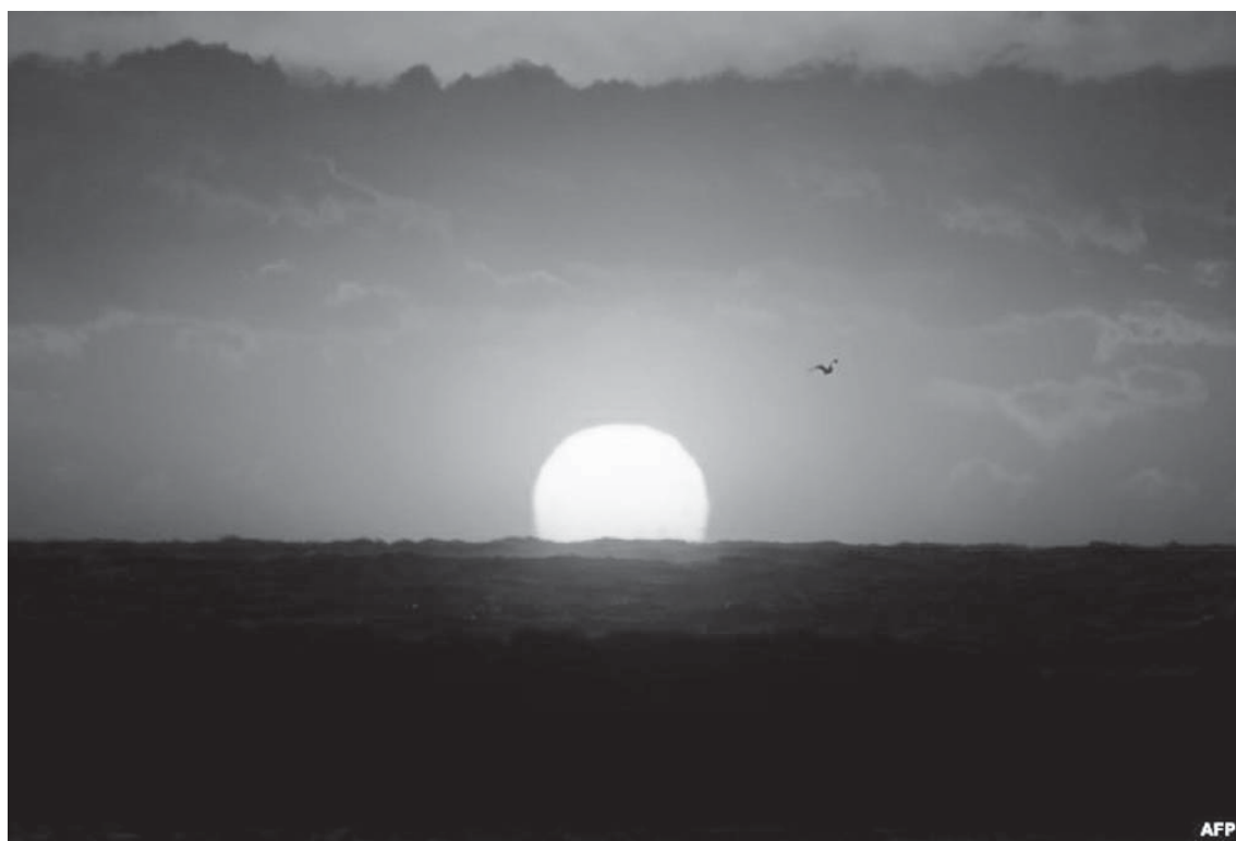
Një pamje që tregon perëndimin e diellit në Detin Mesdhe në Marsejë, në Francën jugore.