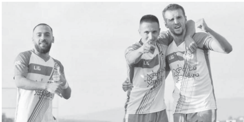
pesta me 29 pikë.

PRISHTINË, 10 MARS - Tri skuadrat favorite për titull, Feronikeli, Prishtina dhe Llapi, kanë regjistruar fitore në kuadër të javës së 22-të në IPKO Superligën e Kosovës në futboll. Diferenca e pikëve në mes të lideres dhe dy skuadrave përcjellëse mbetet pesë pikë. Fitores në këtë xhiro i është gëzuar edhe skuadra kampione në fuqi, Drita nga Gjilani. Gara për mbijetesë është shumë interesante pasi nga vendi i pestë e deri në vendin e parafundit diferenca në mes të skuadrave është vetëm pesë pikë.