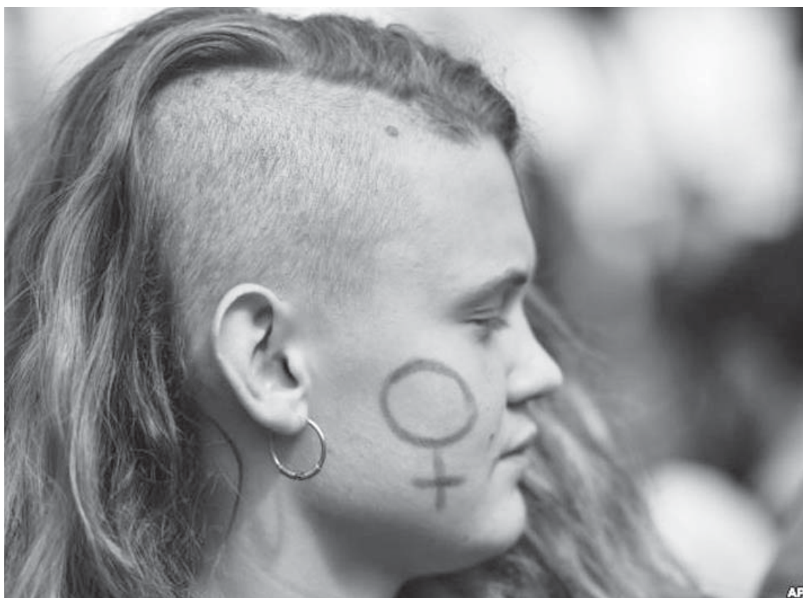
Një demonstrues merr pjesë në një marshim gjatë Ditës Ndërkombëtare të Gruas në Pamplona në Spanjën veriore.