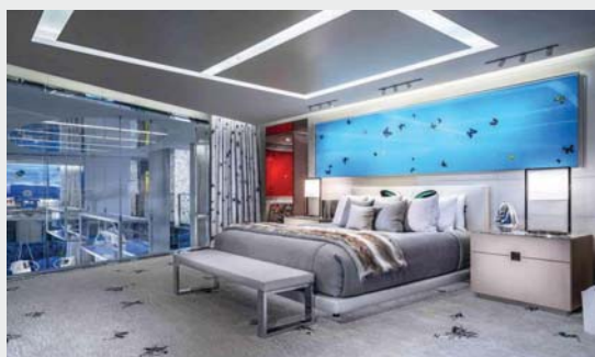
ende në jetë, Daniem Hirst (pasuria e tij llogaritet në 215 milionë paundë)

Suita më e shtrenjtë e hotelit në botë kushton 176 500 euro për dy net dhe gjendet në Las Vegas, në brendësi të Palms Casino Resort. Ajo që e bën kaq të kushtueshme këtë suitë prej pothuajse 900 metrash katrorë janë veprat e artit të artistit më të pasur në botë,