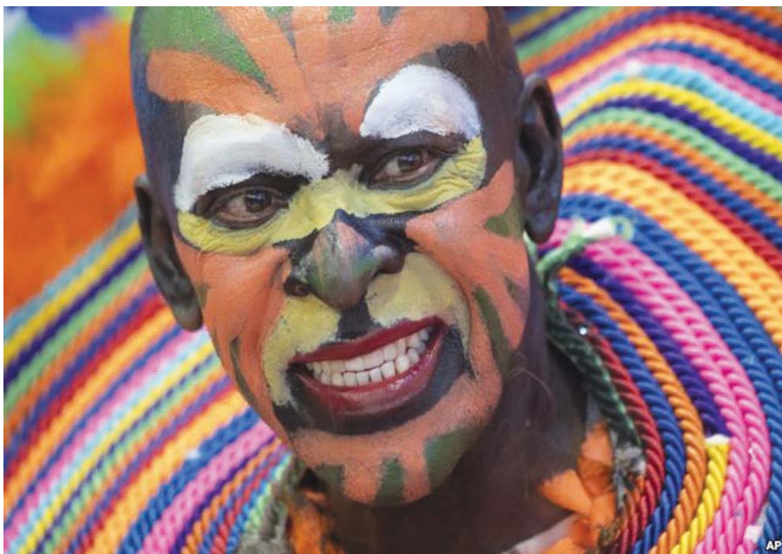
Një burrë me një fytyrë të pikturuar me ngjyra merr pjesë në Panairin e Turizmit ITB në Berlin.