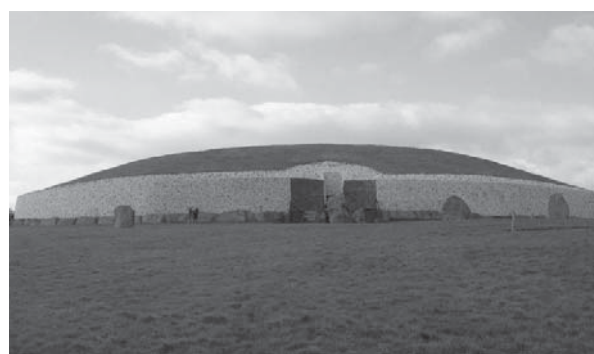
"varr kalimi". Shumica e mbetjeve njerëzore janë trupa të djegur dhe pranë tyre kanë gjetur sfera prej guri, në formë dekorimi, si dhe rruaza.

Kompleksi i Njugrejnxhit është ndërtuar rreth 3200 vjet para erës sonë. Megjithatë, njerëzit modernë e zbuluan vetëm në vitin 1699, kur një pronar toke donte të bënte gërmime për të nxjerrë gurë. Bëhet fjalë për një strukturë rrethore, me një tunel prej guri brenda dhe me dhoma anash. Arkeologët e kanë quajtur si