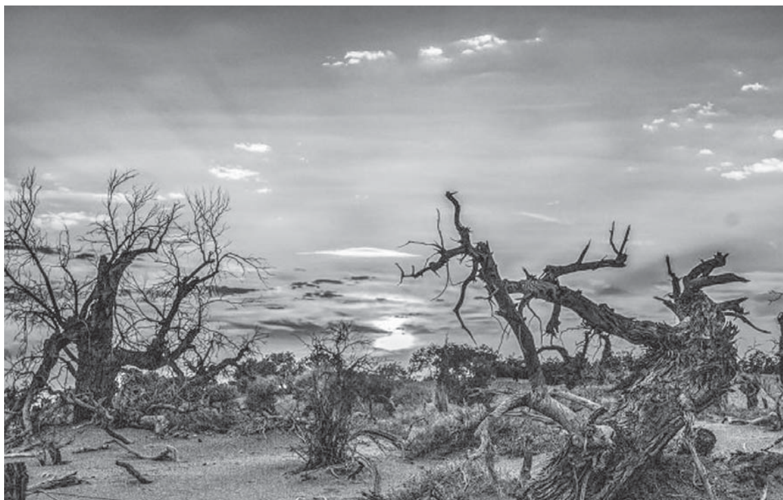
Një pyll në Mongolian është emërtuar "Pylli i çuditshëm" pas formave të çuditshme të drurëve të vdekur.