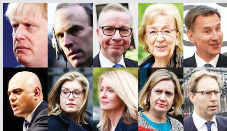
Konservatore, që e mbylli me një vend të pestë poshtërues në zgjedhjet evropiane, javën e kaluar, me vetëm 9% të votave.

Zvarritjet kohore për Brexitin i kushtuan shtrenjtë Partisë