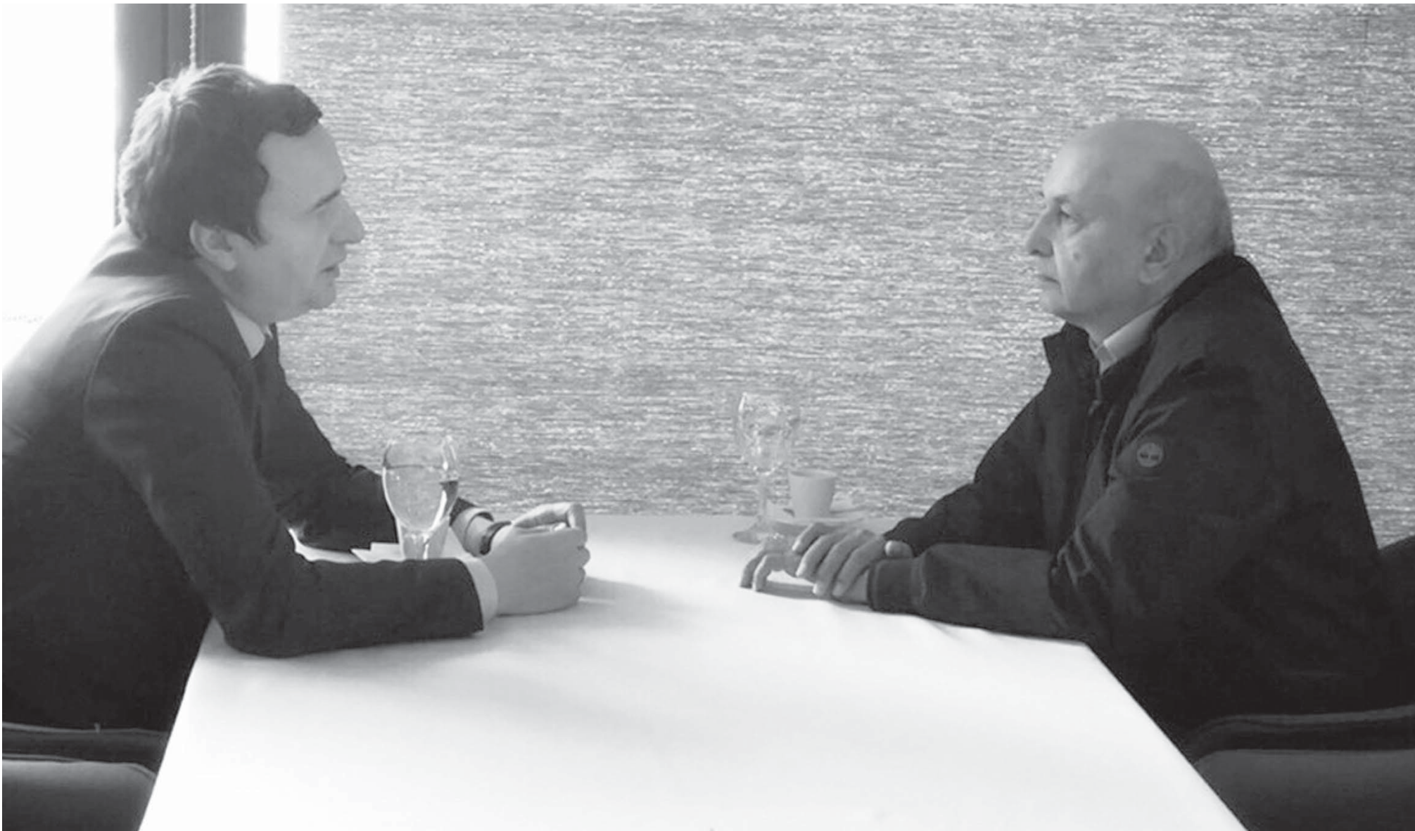
Takohen liderët e dy subjekteve më të mëdha opozitare