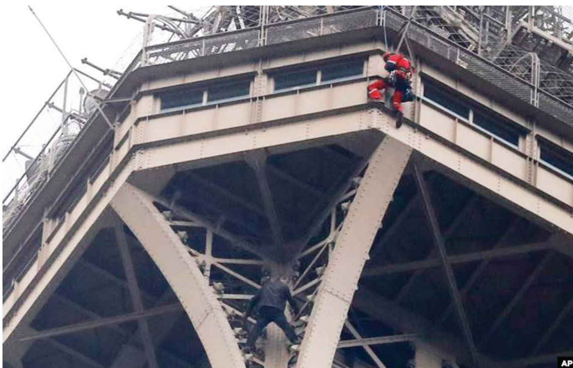
Një person i skuadrës së zjarrfikësve shihet duke tentuar ta shpëtojë një vizitor i cili kishte mbetur në strukturën e kështjellës së Eiffelit në Paris, i cili kishte thyer rregullat e një vizitori.