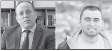
Shkrim autorial nga Ferat SHALA & Liridon SEJDIU

Republika e Kosovës, si shtet i ri, në rrugëtimin e saj të tranzicionit po bart me vete specifika shumë të veçanta politike, ekonomike dhe sociale. Në esencë, ky rrugëtim i Kosovës me vete po bart edhe plagë të së kaluarës dhe të tashmes, plagë të cilat do të duhej të shëroheshin dhe të mbylleshin me një afat sa më të shkurtër, që rrugëtimi i shtetndërtimit dhe i zhvillimit të jetë më i shpejtë, më dinamik, më i shëndetshëm dhe më reprezentues brenda dhe jashtë vendit.