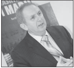
Shkruan: Bardhyl MAHMUTI

Duke e nxjerrë në rend të parë mënyrën se si është kryer krimi (masakrimin), ne e zhvendosim në rend të dytë atë që është thelbësore: qëllimin.