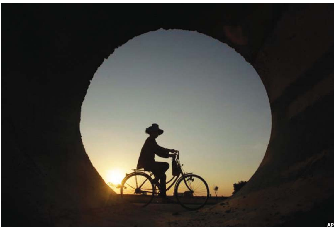
Një njeri shihet me biçikletë në fshatin Samroang në Kamboxhia