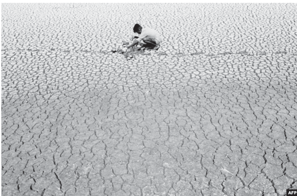
Një fëmijë indian shihet duke lozur në liqenin e thatë në periferi të Chennait.