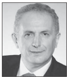
Shkruan: Bardhyl MAHMUTI

Përkufizimi i gjenocidit në Kodin Penal të Republikës së Kosovës është përkthim nga gjuha serbe dhe është i pasaktë. Në dy shkrimet paraprake trajtova përdorimin e gabueshëm të termeve "zhdukje" dhe "shfarosje" kur bëhet bartja kuptimore që këto terme kanë në gjuhën e zakonshme dhe emërohen kategori të caktuara të së drejtës penale ndërkombëtare.