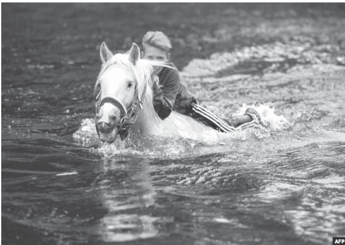
Një i ri shihet duke kaluar me kali në lumin Eden në Angli.