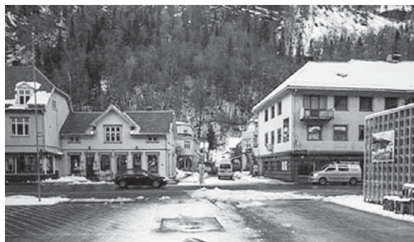
drejtpërdrejtë nga muaji shtator deri në mars. Ai njihet si qyteti më i errët në botë.

Ka vende në botë ku njerëzit mësohen të jetojnë pa rrezet e diellit dhe shpesh iu nënshtrohen terapi me dritë. Në përgjithësi kjo ndikon negativisht në shëndetin fizik dhe atë mendor, pasi një pjesë e madhe e njerëzve preken nga depresioni. Kjo, gjithashtu, ndodh në Rjukan, në qytetin norvegjez të rrethuar me male, i cili nuk ka dritë të