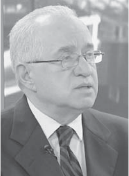
Shkruan: Prof. Lisen BASHKURTI

Në pështjellimin e sotëm politik retorika propagandistike po përpiqet që ta përkeqësojë situatën duke hedhur në turrën e druve edhe aktin unik publik: Kushtetutën e Republikës së Shqipërisë dhe duke rrezikuar republikanizmin si formë qeverisëse. U bënë thujtë tri dekada tranzicion dhe sërish politika shqiptare nuk ka mësuar se kur duhet të heshtë dhe kur duhet të flasë. Kur flet Kushtetuta, respektivisht institucionet përfaqësuese dhe garantuese të saj, Gjykata Kushtetuese dhe, në mungesë të saj, presidenti i Republikës, politika lypet të heshtë. Kur flet kriza politike dhe nevojitet dialog e kompromis për zgjidhjen e saj, politika duhet të flasë. Te ne rëndom ndodhë e kundërta.