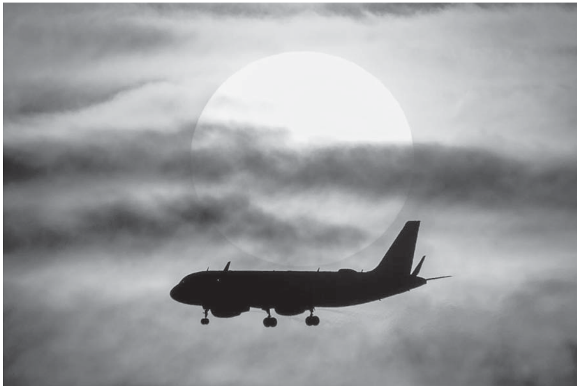
Një avion shihet në afërsi të aeroportit në Frankfurt derisa dielli perëndonte.