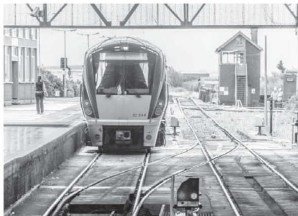
Kildare të martën, me ndihmën e disa udhëtarëve në bord. Foshnja erdhi në jetë e shëndetshme.

Një grua ka sjellë në jetë fëmijën e saj në tren gjatë udhëtimit nga Ceant në Heuston. Foshnja ka fituar udhëtime falas me tren për 25 vjetet e ardhshëm. Gruaja e re u detyrua ta lindte vajzën në trenin e Galway-Dublin në