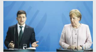
konfliktin që ka lënë rreth 13 000 persona të vdekur.

ndaj Ruisë, duke përfshirë ngrirje të asetëve dhe bllokim të marrjes së vizave për individë dhe entitete ruse, pasi Moska ka pushtuar Gadishullin e Krimesë nga Ukraina më 2014 dhe ka mbështetur nga ajo kohë, separatistët në lindje të Ukrainës, në