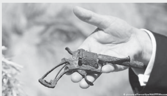
periudhë kohore dhe me të njëjtin kalibër plumbi që i mori jetën Van Goghut.

Revolveri, i cili mund të jetë përdorur nga piktori Vincent van Gogh për t'u vetëvrasur, u shit në një ankand për 162 500 euro, rreth tri herë më shumë sesa pritej. Arma e ndryshkur u ble përmes telefonit nga një koleksionist privat. Ajo u gjet nga një fermer në vitin 1965 pranë fshatit kur artisti kaloi ditët e fundit të jetës. Ishte afërsisht e njëjta