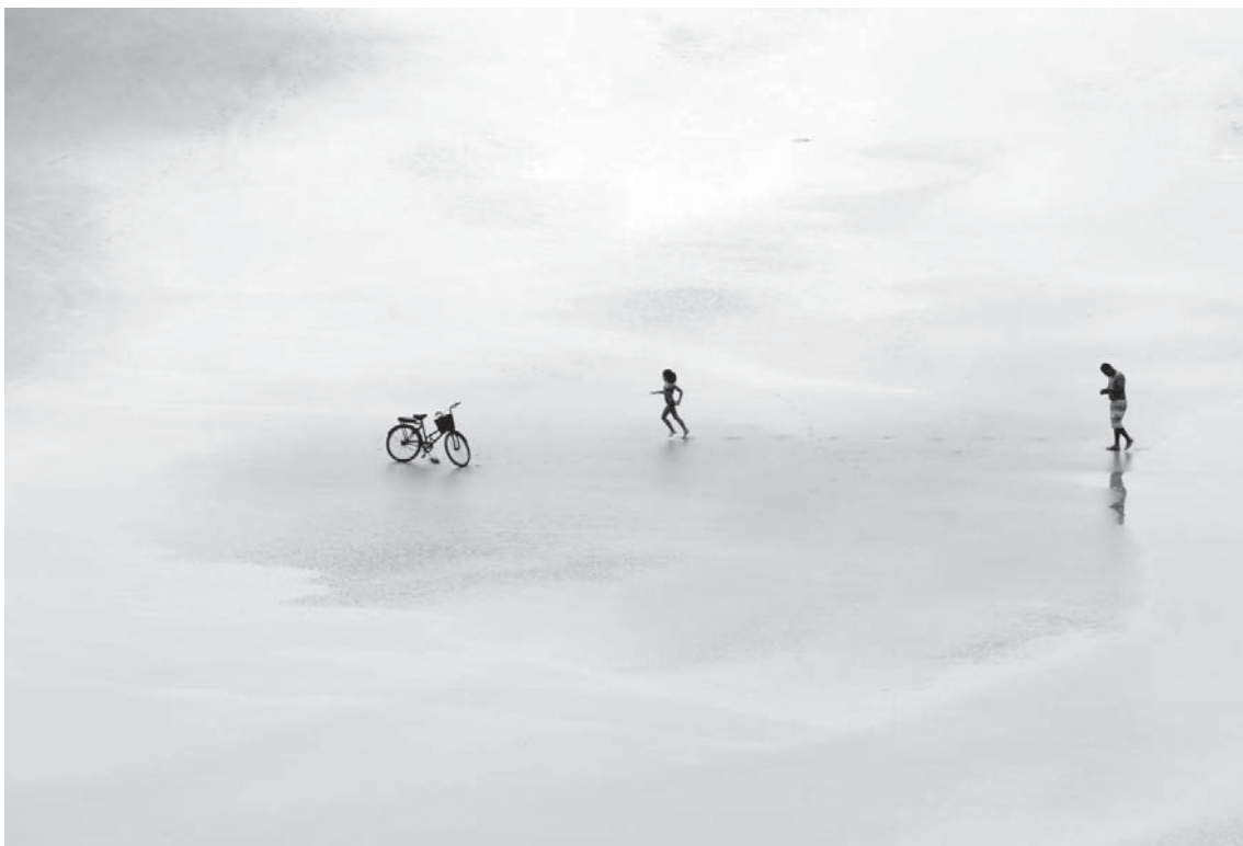
Një vajzë shkon drejt biçikletës së vet në një plazh në Guaruja, shteti i Sao Paulos në Brazil. Fotografia është publikuar te "Zëri i Amerikës".