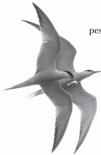
Një zog mbulon një tjetër gjatë fluturimit derisa në sqep mban një peshk të marrë në lumin në Portland.