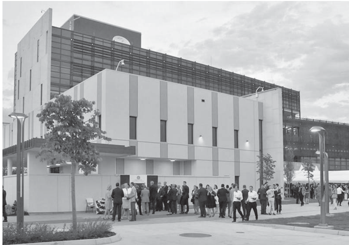
Në 243-vjetorin e shpalljes së Pavarësisë së Shteteve të Bashkuara të Amerikës (ShBA-së) në Prishtinë, Ambasada e ShBA-së ka përruruar objektin e ri.