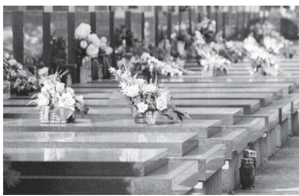
kur pësoi aksident. Mjekët e deklaruan të vdekur të hënën, pasi një nga familjarët i tha se nuk kishin para për ta paguar mjekimin e tij.

Një i ri indian, i shpallur i vdekur nga mjekët, u zgjua pak para se të varrosej gjatë funeralit. Mohammad Furqan u deklarua i vdekur, por ai u ngrë papritur në funeralin e tij në qytetin indian të Lucknow. 20-vjeçari u dërgua menjëherë në spital. Furqan ishte pa ndjenja që më 21 qershor