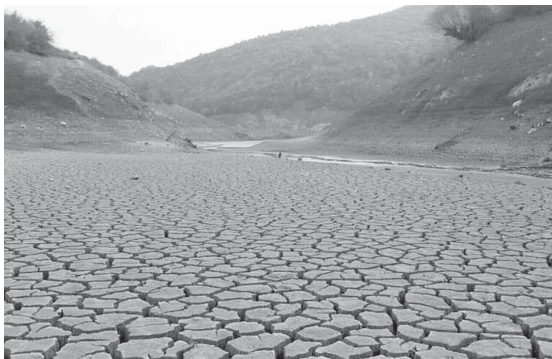
Gjendje e mjerueshme e Liqenit të Përlepnicës në Gjiçan. /ER/