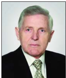
Shkruan: Mehmet HAJRIZI

8. Transformimet demokratike në rajon, nuk patën asnjë efekt pozitiv për të drejtat e shqiptarëve në Jugosllavi, sepse regjimi kriminal i Slobodan Milosheviqi, u vërsul me të gjitha mjetet për ta suprimuar edhe atë autonomi që kishte Kosova dhe vendosi aty masa të dhunshme në çdo fushë të jetës, duke përfshirë popullsinë shumicë shqiptare nga jeta politike, ekonomike, arsimore, kulturore, informative etj. Për pasojë, popullsia shqiptare u ndodh në një gjendje edhe më të rëndë dhe më të padurueshme.