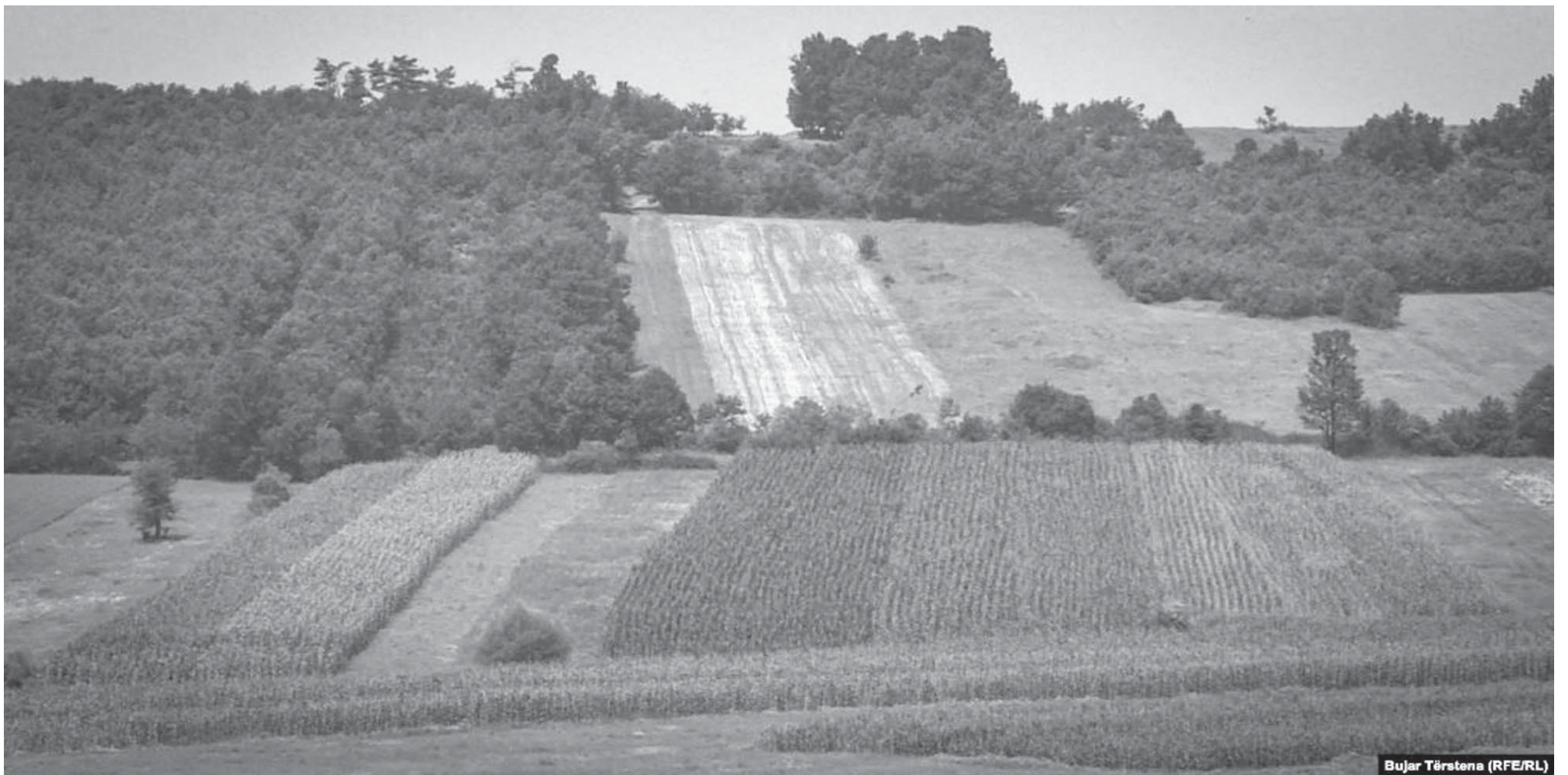
Bujar Tërstena (RFE/RL)

Qeveria e Kosovës në fund të vitit 2017 kishte marrë vendim për ta pezulluar përkohësisht, për një afat njëvjeçar, privatizimin e tokave në pronësi shoqërore, në mënyrë që të verifikohen nevojat që kanë institucionet shtetërore për prona, me qëllim të nxitjes së zhvillimit ekonomik dhe investimeve.