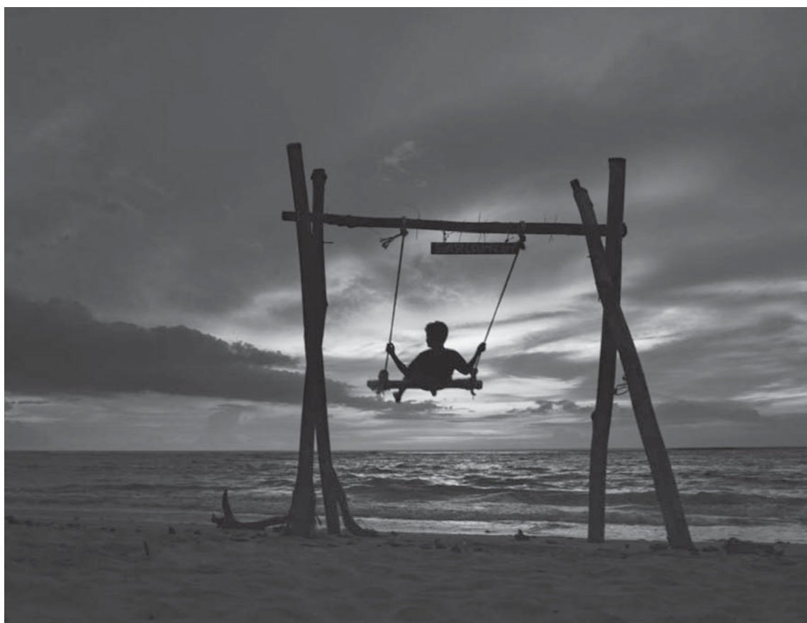
Një fëmijë shihet duke u luhatur në plazhin Lhoknga në provincën Aceh të Indonezisë.