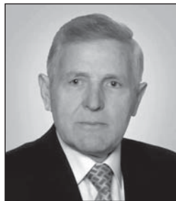
Shkruan: Mehmet HAJRIZI

1 Ky publikim është një protestë dhe akuzë kundër një lufte të ndyrë të fundshekullit të kaluar që bëri regjimi serb i Millosheviqit famëkeq ndaj grave dhe vajzave shqiptare në Kosovë. Institucionet e dhunës të këtij regjimi mizor kur përdhuan femrat shqiptare kishin për qëllim thyerjen morale të popullit që po i rezistonte, kur vranë 1392 fëmijë donin t'ia gjymtonin edhe të ardhmen dhe kur i dogjën 120.000 shtëpi, shpesh me njerëz brenda, bënë gjenocid, duke deportuar dhe zhbërë një popull të tërë nga vatra e vet.