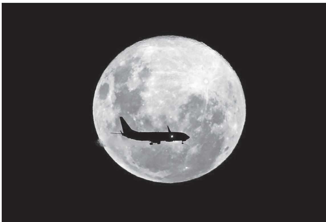
Një aeroplan kalon para hënës së plotë në Brazil.