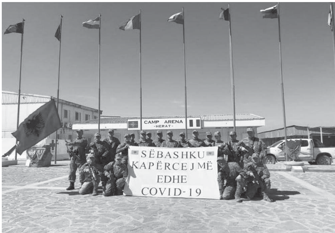
Ushtarët e Shqipërisë solidarizohen dhe japin kurajë nga Afganistani pas përhapjes së koronavirusit.