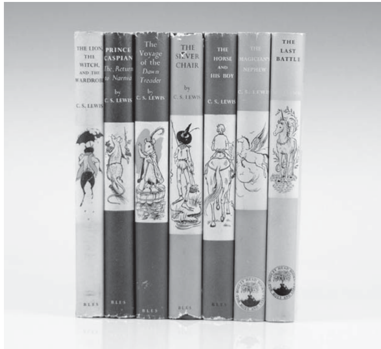
“Kronikat e Narnias” nga C S Lewis

Kam thënë më parë se arti i dobët nuk shijohet kurrë në të njëjtën kuptim si shijohet arti i mirë. Thjesht arti “i pëlqyer” asnjëherë nuk befason, nuk trondit, nuk të bën rob të tij. Tani, që e them këtë, na del përpara një vështirësi. Dhe kjo vështirësi s’është shpjeguar nga askush kaq mirë se sa nga artisti i shkëlqyer dhe i shpërfillur Forrest Reid. Në autobiografinë e titulluar “Apostate” ai përshkruan kënaqësinë që kishte marrë kur ishte djalos, gjatë leximit të librit