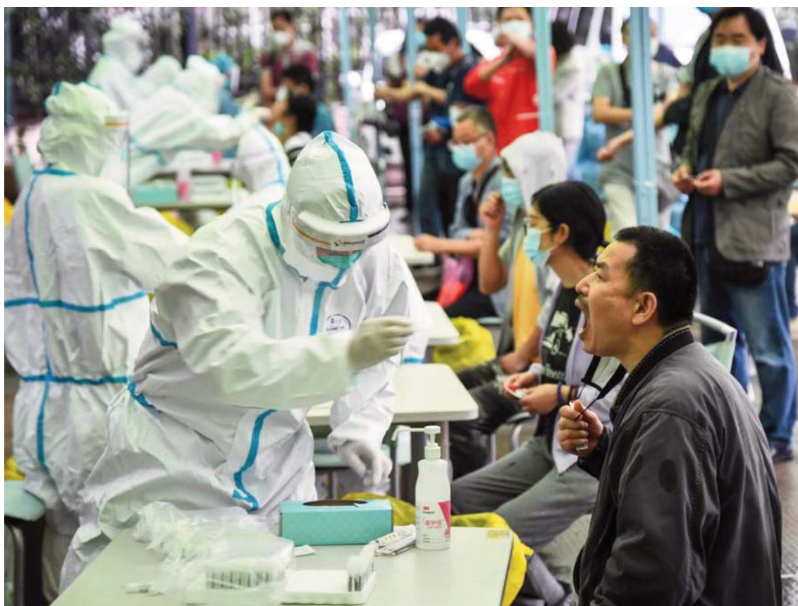
Një punëtor mjekësor shihet duke ia bërë një mostër një banori në Kinë për testim për Covid-19.