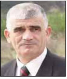
Shkruan: Kudusi LAMA

Megjithatë, është e ditur se Serbia në tërë jetën e saj si komb dhe si shtet vazhdimisht ka arritur që të sigurojë mbështetje nga shumë shtete të mëdha të Evropës. Kjo ka ardhur si rezultat e lidhjes së qëndrimeve politike me interesat ekonomike. Këto interesa kanë krijuar një klimë proserbe në praktikën e politikës evropiane, që ta krijojë idenë e hidhur të një miqësie midis tyre, e cila shkon deri në verbëri totale të kësaj politike ndaj veprimeve serbe kundër popullit të Kosovës.