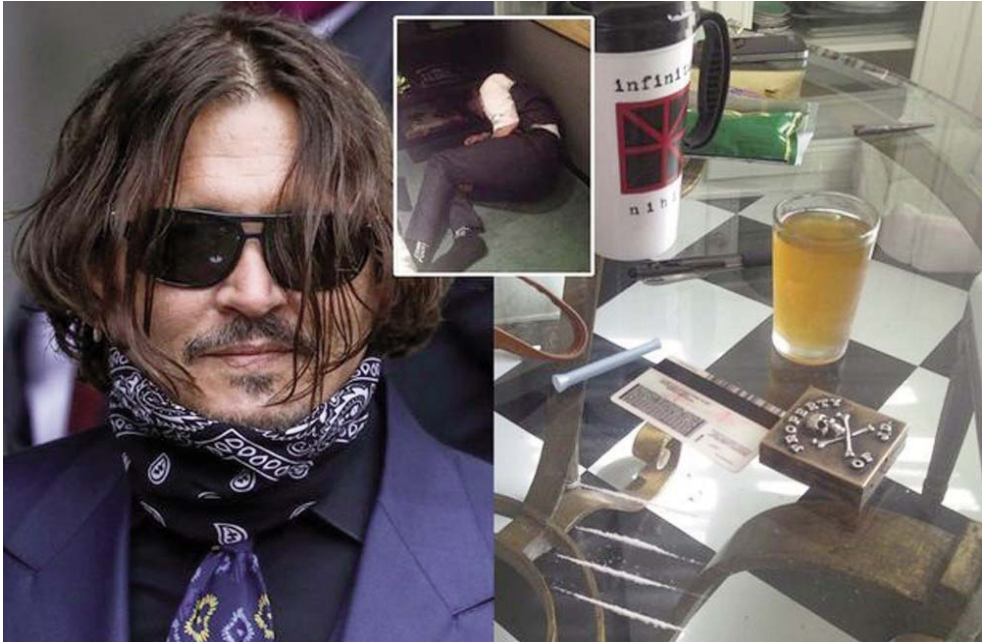
Foto shokuese të jetës kaotike me droga dhe alkool janë shfaqur në Gjykatën e Lartë në Londër, ku ylli i Hollywoodit, Johnny Depp, është në betejë ligjore me gazetën britanike "The Sun" dhe ish-gruan Amber Heard. Protagonisti i filmit "Piratët e Karaibeve" ka paditur gazetën që e

ka quajtur "rrahës i grave", për çka Depp ka thënë se janë pretendime "të sëmura dhe të pavërteta". Depp pranon se ka përdorur kokainë dhe ka thënë se ish-gruaja e tij shfrytëzon përdorimin e drogave për ta quajtur "monstër". Në fotografi tregohet masa e vërtetë e abuzimit të Deppit me substancat.