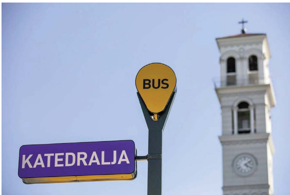
Komuna e Prishtinës ka vendosur kabinat e reja për pritjen e autobusëve