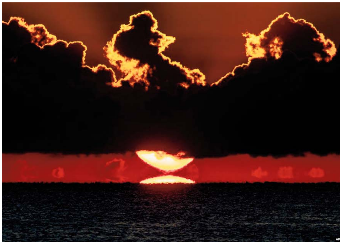
Dielli lind mbi detin Baltik në Gjermaninë veriore.