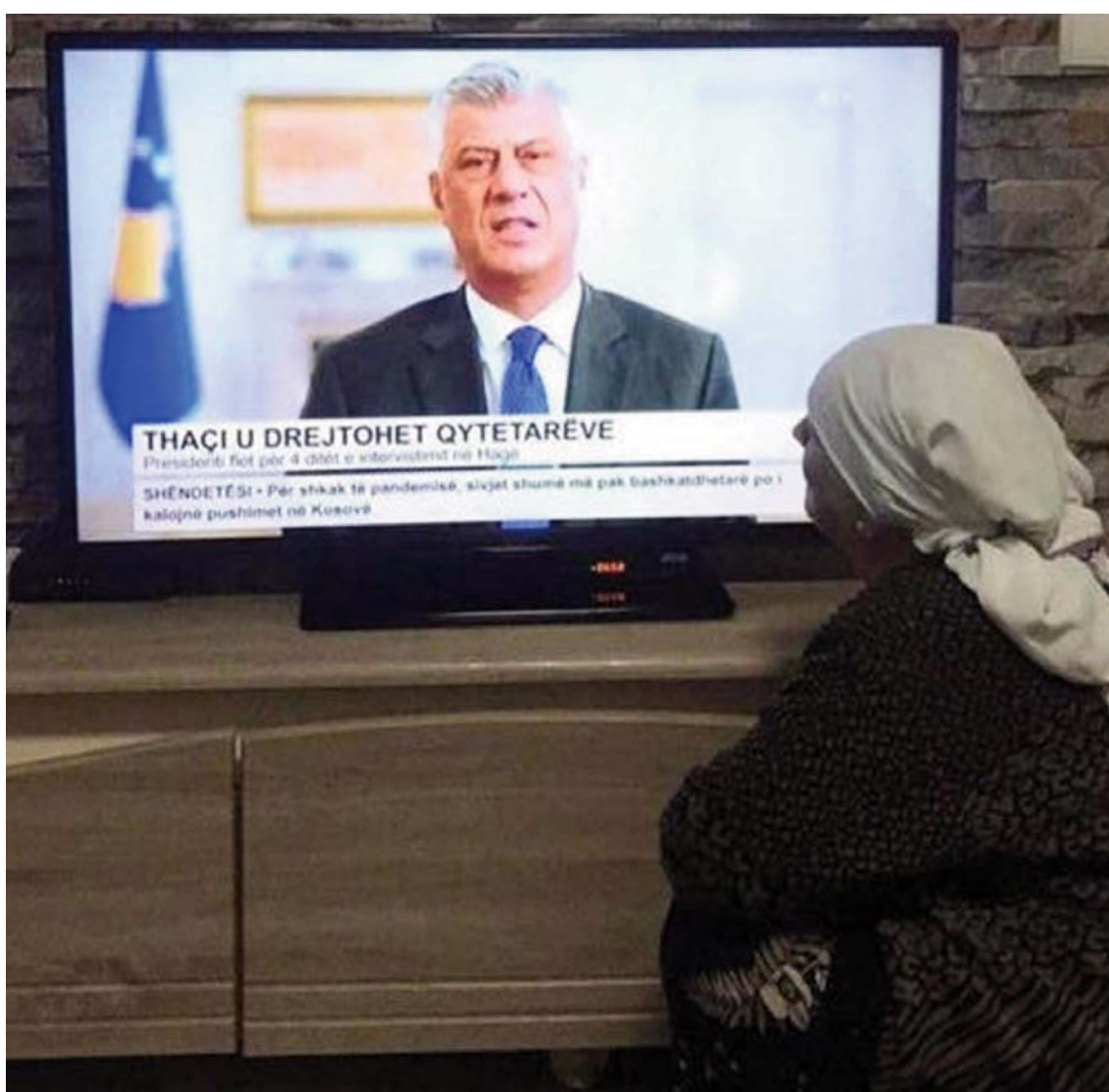
Një nënë shqiptare shihet afër televizionit duke shikuar fjalimin e presidentit Hashim Thaçi pas kthimit nga Haga.