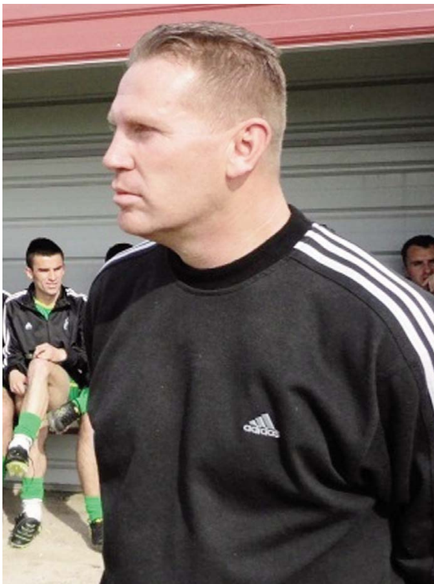
skuadrën e Dritës me rezultat 2-0, kurse në derbin tjetër në mes të