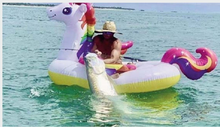
peshk gjigant. Shokët e tij ishishin afër me një varkë dhe gjiruan këtë çast interesant.

Peshkimi si hobi është shumë i vjetër. Peshkimi ka qenë një burim i madh i ushqimit në kohën parahistorike. Me teknika të ndryshme dhe mënyra të njerëzimit mund ta shijojnë kohën e tyre në lumë, liqene apo edhe në varka të mëdha në dete. Një video tregon një burrë i zili po peshkonte nga një gomë për pishinë. Ai me gomën e tij në deti po peshkonte dhe zuri një