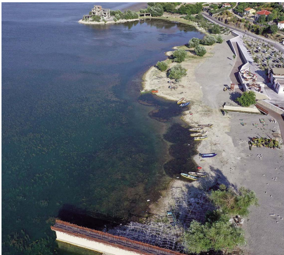
Pamje mahnitëse nga Shiroka e Shkodrës.