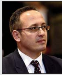
Shkruan: Seremb GJERGJI

Presidenti Trump në shikim të parë duket se është person i veprimeve të shpejta dhe të pamatura mirë. Por, kjo vjen për dy arsye: 1. Trump e do Amerikën më shumë se cilido president deri më tash; dhe 2. Vepron me mendjen e një biznesmeni. Kjo i jep atij një avantazh të jashtëzakonshëm. Si shqiptar, e di që krejt të rinjtë me origjinë shqiptare në Amerikë, madje edhe disa prindër të tyre do ta votojnë Trumpin. Vlera e kapitalit njerëzor.